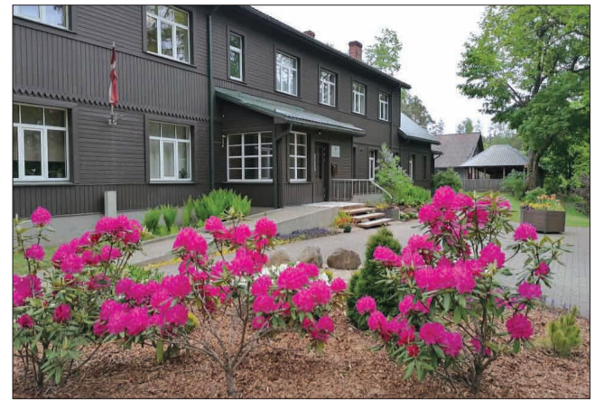
Rododendru laiks Strenčos