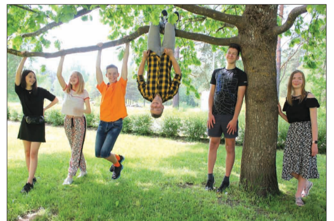
Strenču Mūzikas skolas absolventi