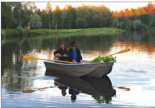
Vakara mūzika uz Gaujas