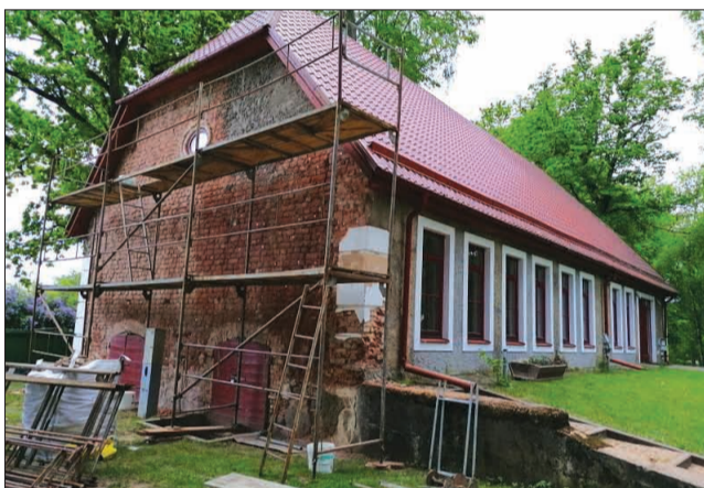
Mednieku nama remonts