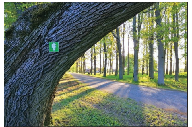
Jērcēnmuižas parka stiprie un varenie