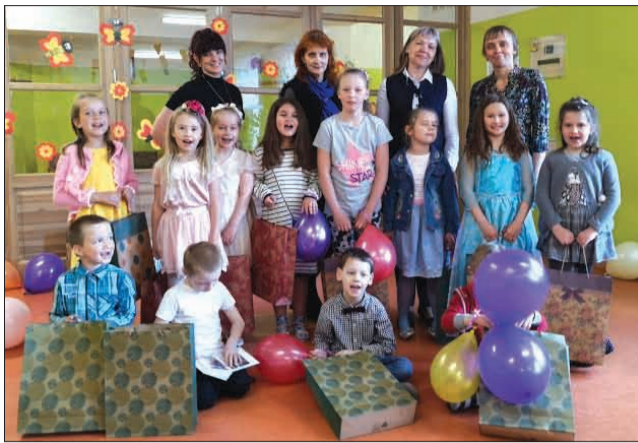
"Minkāna" izlaiduma grupas audzēkņi