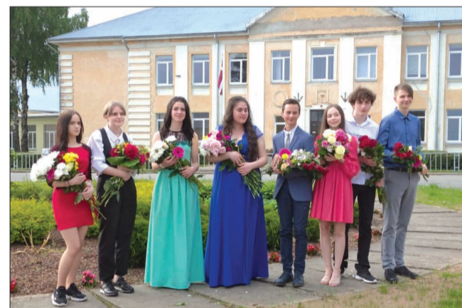
Strenču novada vidusskolas Sedas filiāles 9. klases absolventi