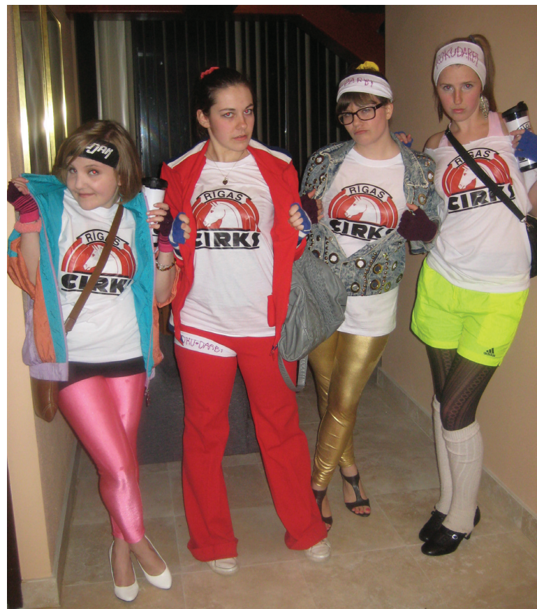
Rīgas cirka meitenes