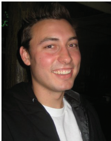
Niks Bārs - Kultūras tēma, filmēšana