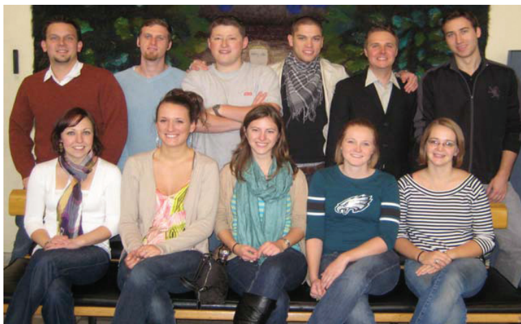
2009. gada ALJA valdes locekļi apmeklējot ANO