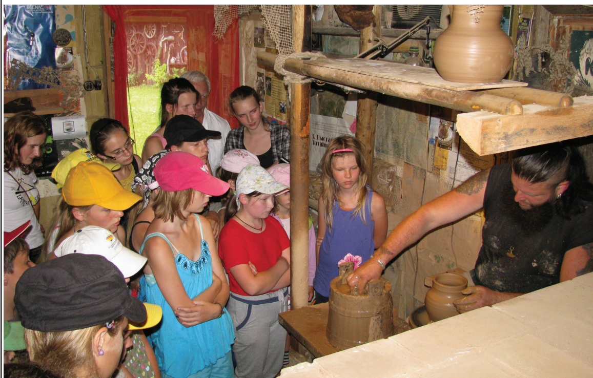
Jaunieši Latgales keramiķa A. Ušpeļa darbnīcā

Arturs Tālivaldis Rubenis, latgaļu dramaturgs (ASV)