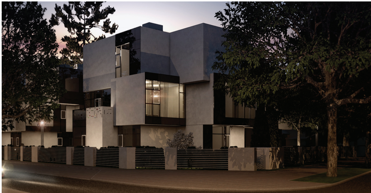
Jūrmalā, Majoros top dārga dzīvokļu ēka ar interesantām ģeometriskām figurām

Pilsonības un migrācijas lietu pārvalde konstatējusi, ka tikai 10%-15% no uzturēšanās atļaujas saņemušajiem ārvalstu investoriem un viņu ģimenes locekļiem