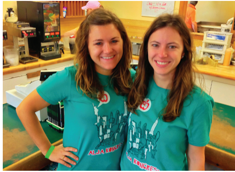
Iegādājies ALJA 60 kongresa kreklus!

varat atrast mūsu mājas lapā: http://nyckongress12.virb.com/ kā arī šī mēneša ALJAs Ziņas izdevumā!