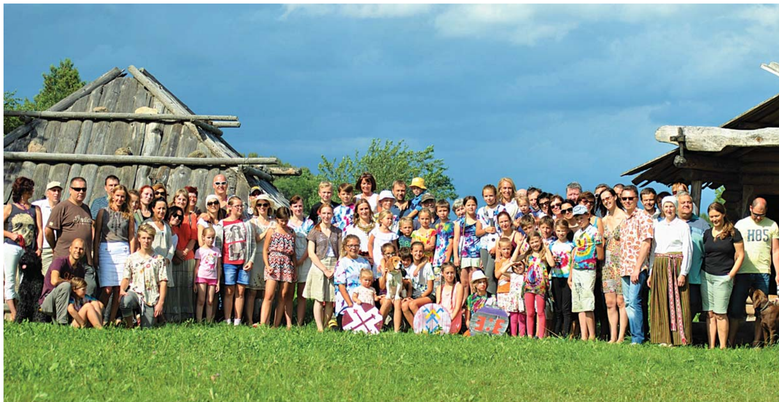
Bērnu tradicionālās kultūras nedēļas dalībnieki un vecāki 2016. gada augustā "Latgaļu sātā"

nālo nemateriālās kultūras mantojuma sarakstu. Te lieti noderētu citu valstu pieredze, lai konstatētu, kādā stāvoklī mūsu valstī atrodas, piemēram, tradicionālā amatniecība. Šveices Profesionālās izglītības un tehnoloģiju federālā biroja uzdevumā veikts apjomīgs pētījums par tradicionālās amatniecības stāvokli. Tā ir sava veida inventarizācija, kuras