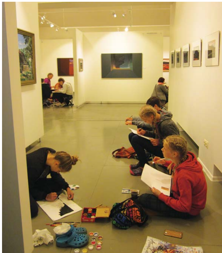
Latvijas skolu audzēkņi PLMC apmeklējumu pārvērs par mākslas stundu, tuvāk iepazīstot Jāņa Kalmītes un Lelde Kalmītes (Čikāga) darbi.

PLMC šogad turpina savu ceļojošo izstāžu programmu, un 15. decembrī paredzēta diasporas mākslas izstādes atklāšana Ludzas Novadpētniecības muzejā.