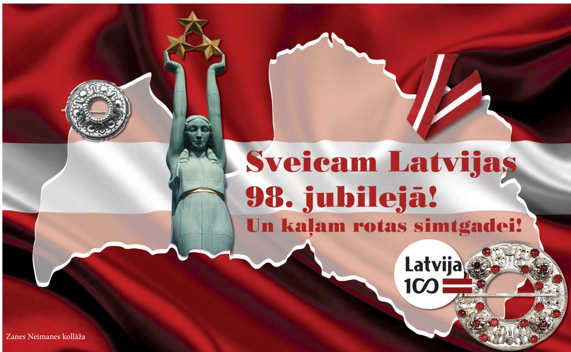
Zanes Neimanes kollāža

2016. gada 19. novembris – 25. novembris