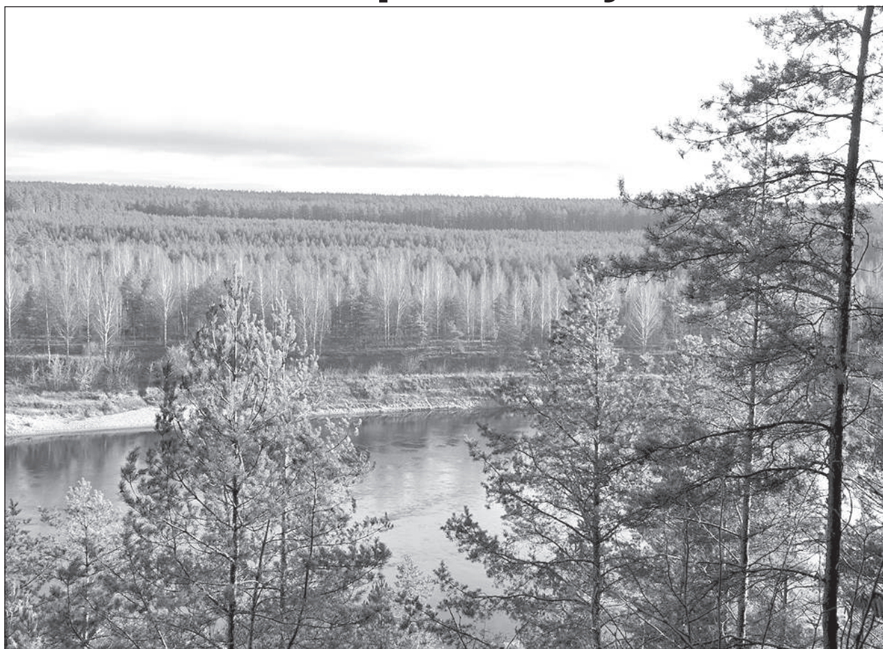
Вид на Даугаву.