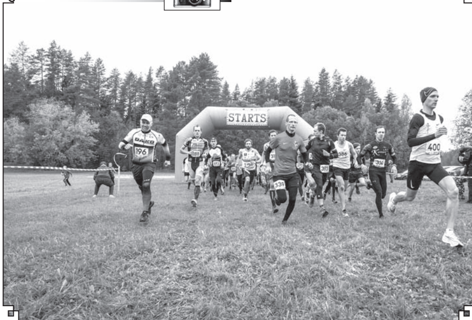
Valkas četrcīņas pēdējais posms - skrējiens apkārt Zāģezeram