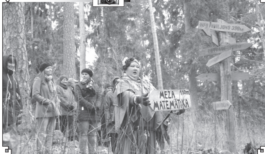
«Lustiņdruoas meža matemātika un astronomija» vides objektu iepazīšana