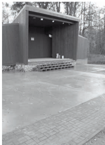
Liepnas estrādes grīdas segums

ka bērni un jaunieši novērtēs jaunā laukuma sniegtās iespējas, lai savu brīvo laiku pavadītu sportiskā garā.