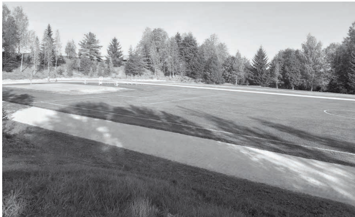
Ziemera pagasta sporta laukums

Pagasta pārvalde ir gandarīta par paveikto – Ziemeru pamatskolas sporta laukuma nodošanu ekspluatācijā un cer,