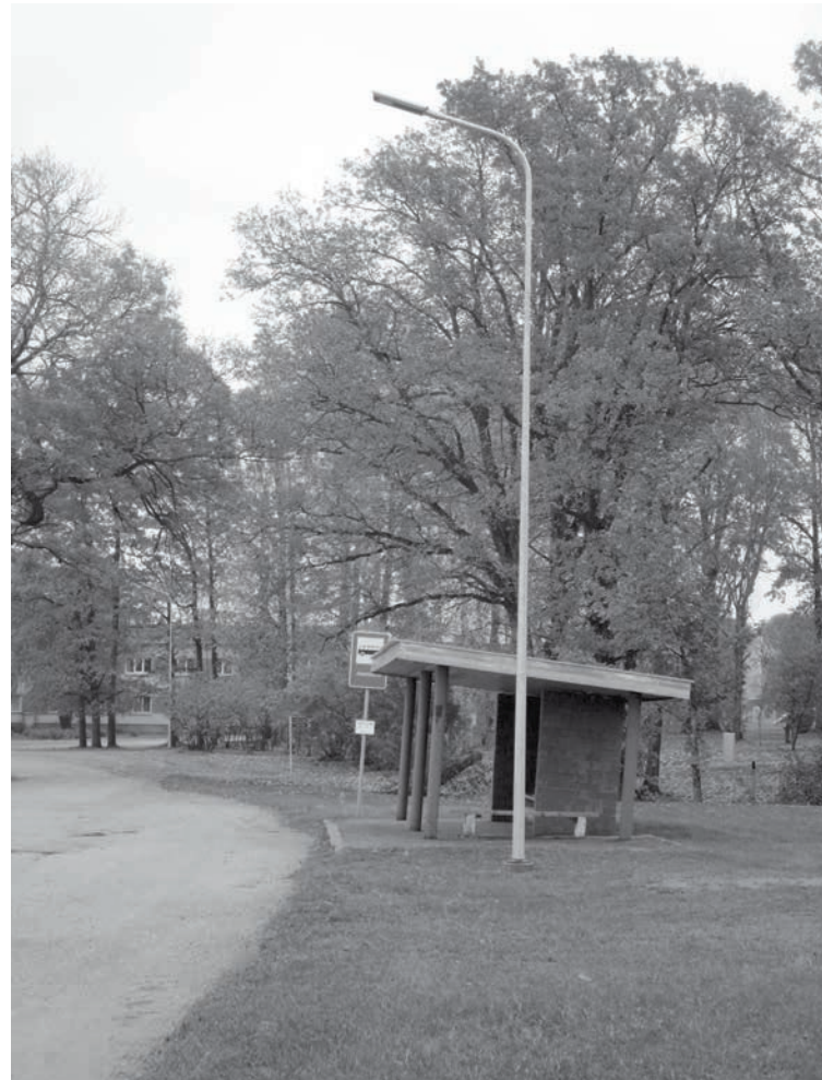
Publisko teritoriju apgaismojums Ilzenes pagastā

Projekta rezultātā tiks izbūvēta 1803 m gara ielu apgaismojuma līnija ar 18 balstiem. Ielu apgaismojums tiks ierīkots Nākotnes un Silmaču ielās, pašvaldības autoceļu Anna-Teikas un Dimanti-Dālderī joslās, kā arī teritorijā pie Annas pagasta pārvaldes, Annas pagasta kultūras nama un sporta centra.