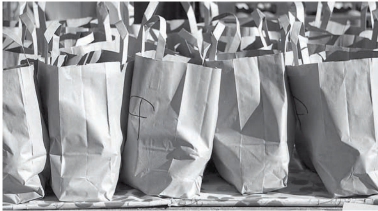
Attēlam ir ilustratīvs raksturs

Pārtikas pakas novada izglītības iestādes sagatavo ēdināšanai paredzētā finansējuma ietvaros, kas katrai izglītības iestādei piešķirts no pašvaldības budžeta, pakas saturu saskaņojot ar iestādes padomi.