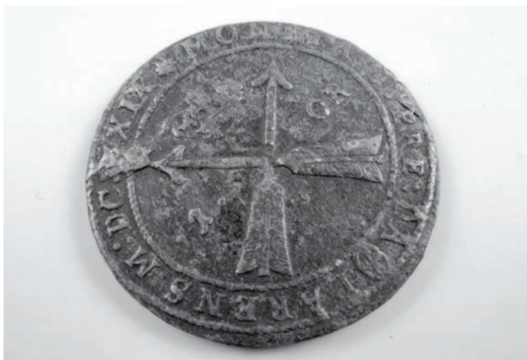
Zviedrijas vara ēre (1629.g.)

Valsts Kultūrkapitāla fonda 2020. gada 3. kultūras projektu