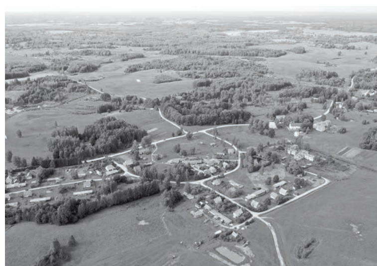
Kalncempju pagasta ainas no drona iemūžinājis Alvijs Grīvnieks

2019. gada nogalē, pētot Kalncempju pagasta Viktora Ķirpa Ates muzeja krājuma fotogrāfijas, tika konstatēts, ka ir ļoti maz pagasta ainavu un māju fotogrāfiju. Laika gaitā Kalncempju kultūrainava ir ievērojami izmainījusies. Līdz mūsdienām nav saglabājušies daudzi objekti, kā arī saimnieciskās un sabiedriskās būves.