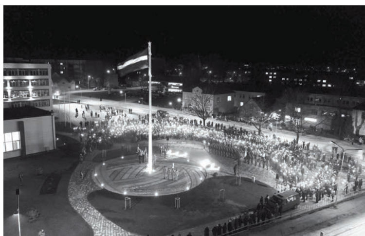
Pirms gada 11. novembrī svinīgi tika pacelts Latvijas valsts karogs monumentālajā mastā Alūksnē

20.00 Latvijas valsts himnas atskaņošana laukumā pie administratīvās ēkas, Dārza ielā 11