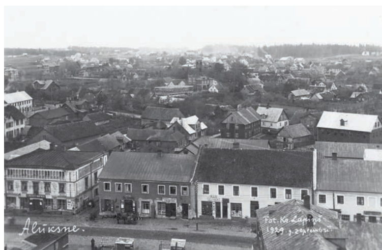
Grāmatas vāku rotās šis vēsturiskais Alūksnes skats