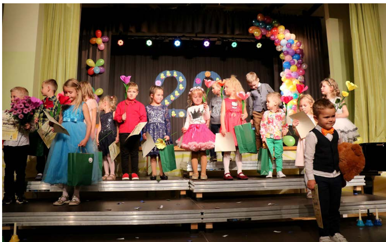
Mazie konkursanti priecīgi par saņemtajiem apbalvojumiem

Ar smaidu, ar smaidu Var draugus sev gūt.