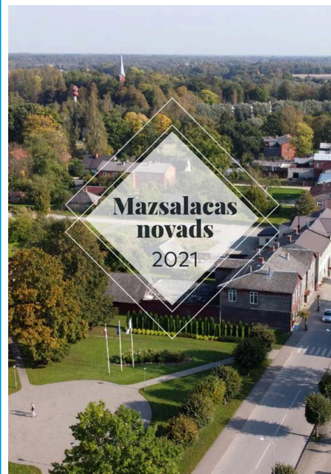
No 10. novembra Mazsalacas novada Tūrisma informācijas centrā varēs iegādāties Mazsalacas novada kalendāru 2021. gadam. Laipni lūdzam apskatīt!