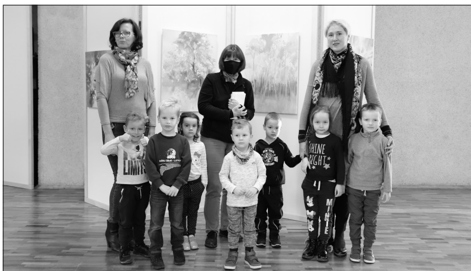
Allažu pamatskolas pirmsskolas izglītības 5-gadnieku grupa