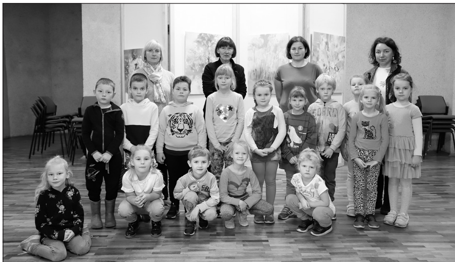
Allažu pamatskolas pirmsskolas izglītības 6-gadnieku grupa