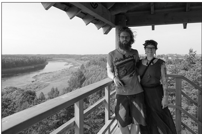
Ambera un Ivars Latvijā pie Daugavas lokiem, 2017. gads