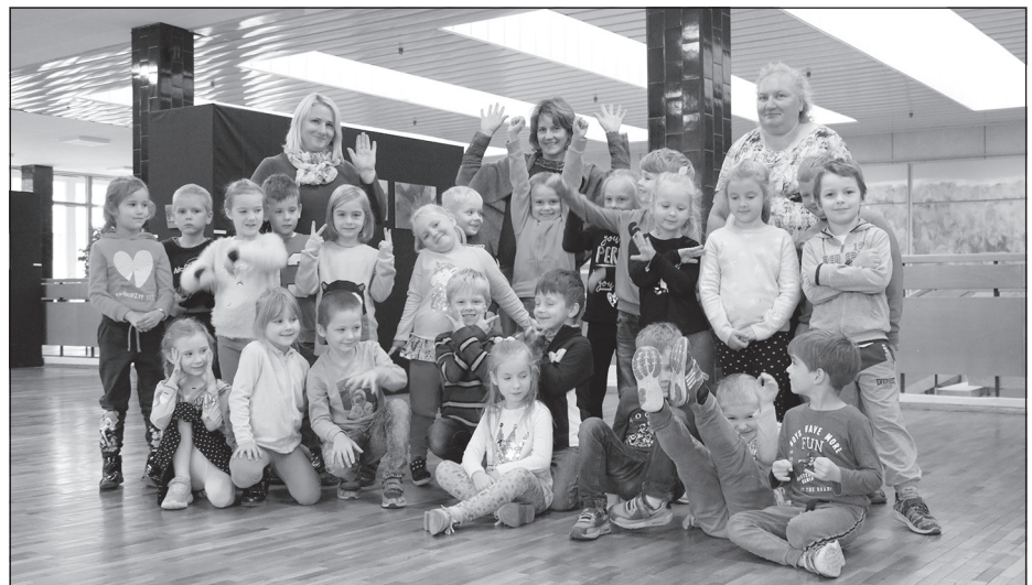
Mālpils PII "Māllēpīte" grupiņa "Pūcītes" Turpinājums 10. lpp.