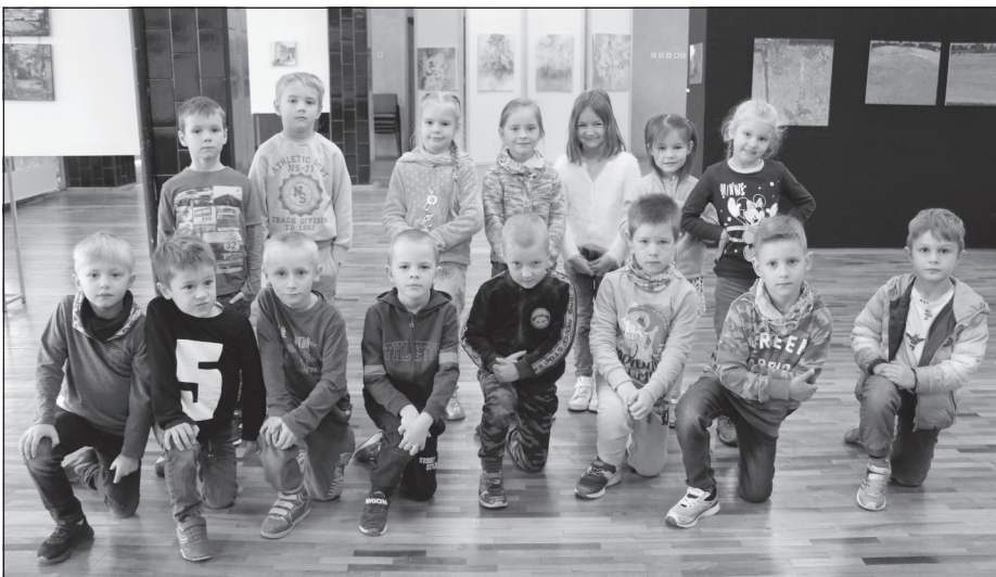
Mālpils PII "Māllēpīte" grupiņa "Taureniši"