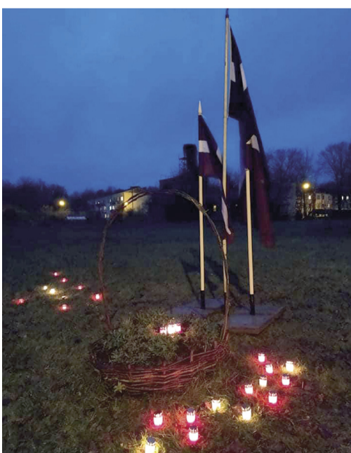
18. novembris Brīzemnieku pagastā.