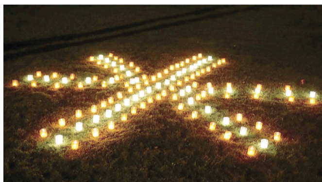
Viena no latvju zīmēm, kas bija iedegta 18. novembrī, Staiceles pilsētā.