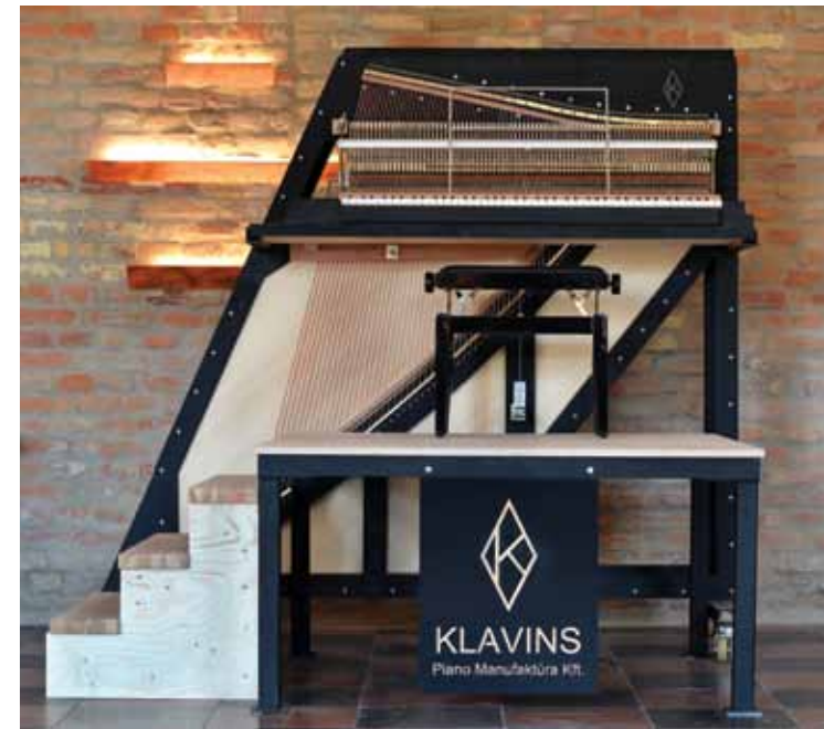
Klavieres Klavins Modell 450 Ventspils mūzikas skolas zālē.

Kā jums radās interese par klavierbūvi? Mani vecāki ir latvieši, kuri Otrā pasaules kara beigās ar vācu vienībām tika aizvesti uz Vāciju. Tēvs ir no Latgales, Balvu rajona Rugāju pagasta, mamma – no Tukuma. Viņi sastapās bēgļu nometnē un palika Vācijā. Mēs bijām astoņi bērni. Tikām audzināti kā patrioti, vecāki ar mums runāja tikai latviski. Bērnuudzīdā, skolā iemācījāmies vācu valodu. Mēs tikām sūtīti – un es to saucu arī par izstūjumu – uz Mīnsteres latviešu ģimnāziju, kur katram pieci gadi bija