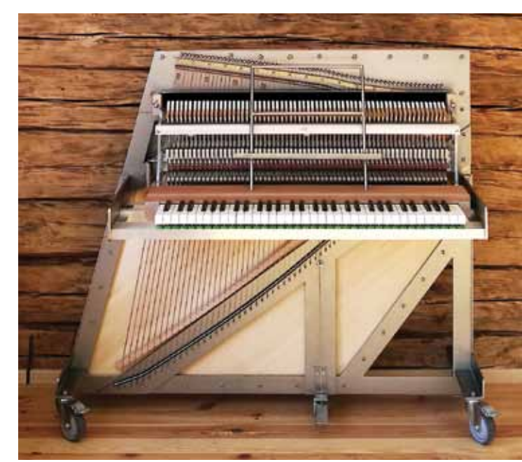
Dāvida Kļaviņa mazo klavieru modelis.

Kā karjera virzījās tālāk? Divus gadus strādāju klavieru veikalā un 1976. gadā nodibināju