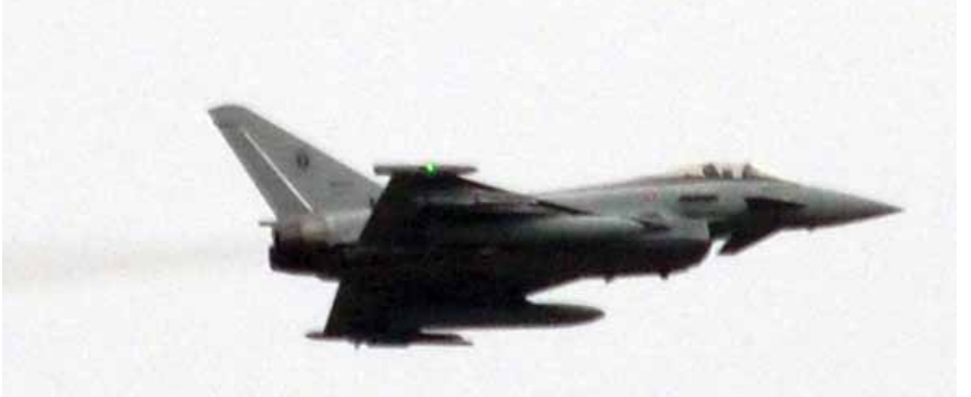
Itālijas Gaisa spēku iznīcinātājs Eurofighter Typhoon. Manevrējot tas rada tik spēcīgu troksni, ka nezinātājam varētu likties – pasaules gals klāt...

Pikējoši iznīcinātāji, kas rada pamatīgu troksni, helikopters gaisā, automātisko un strēlnieku ieroču zalves – tie ir fona trokšņi, ar kuriem no 9. līdz 11. decembrim bija jāsadzīvo tiem Skrundas novada iedzīvotājiem, kuru mājas atrodas blakus militārajam poligonam Mežaine.