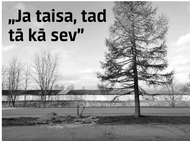
Lapegļu ielā paredzētās laternas vietām atradīsies kokiem pārāk tuvu.