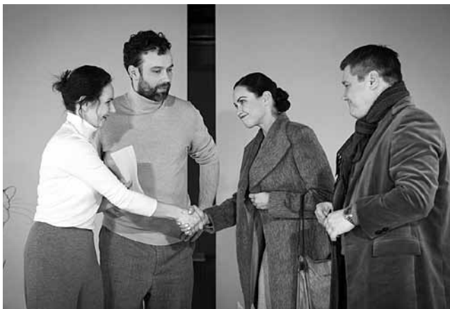
Aina no Latvijas Nacionālā teātra izrādes Slaktiņa dievs .