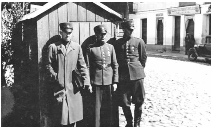
Kuldīgas apriņķa policisti pie posteņa pilsētas centrā.

kas atradās tagadējā O.Kalpaka ielā 3. Tas viss iegrāmatots apskates dokumentos. Pamazām, pamazām policijas struktūra