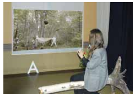
Video un audio instalācija Transformācijas. Vēja slota. Raganas slota .