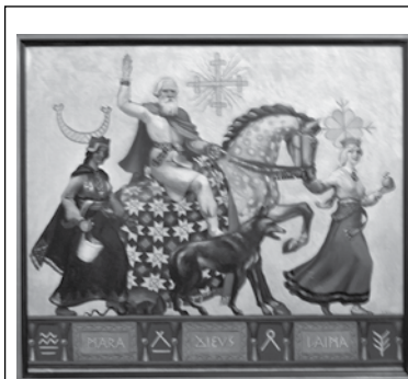
Dievs. Māra. Laima. (1931). Glezna, ko pats autors saucis par dievturības vizuālo piemēru.

Otrā pasaules kara beigās J.Bīne no Rīgas centies bēgt uz