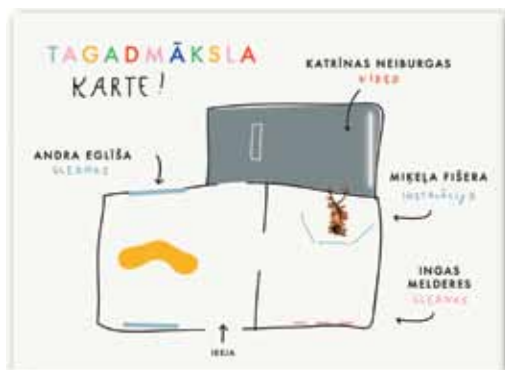
Darba burtnīcā ievietota izstādes karte