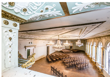
Rīgas Richarda Vāgnera nama telpas pirms atjaunošanas 2020. gada 20. oktobrī

Vācijas Bundestāgs apstiprinājis 5,2 miljonu eiro piešķiršanu Vāgnera nama atjaunošanai Rīgā, informēja Rīgas Richarda Vāgnera biedrības pārstāve Vaiva Bauze.