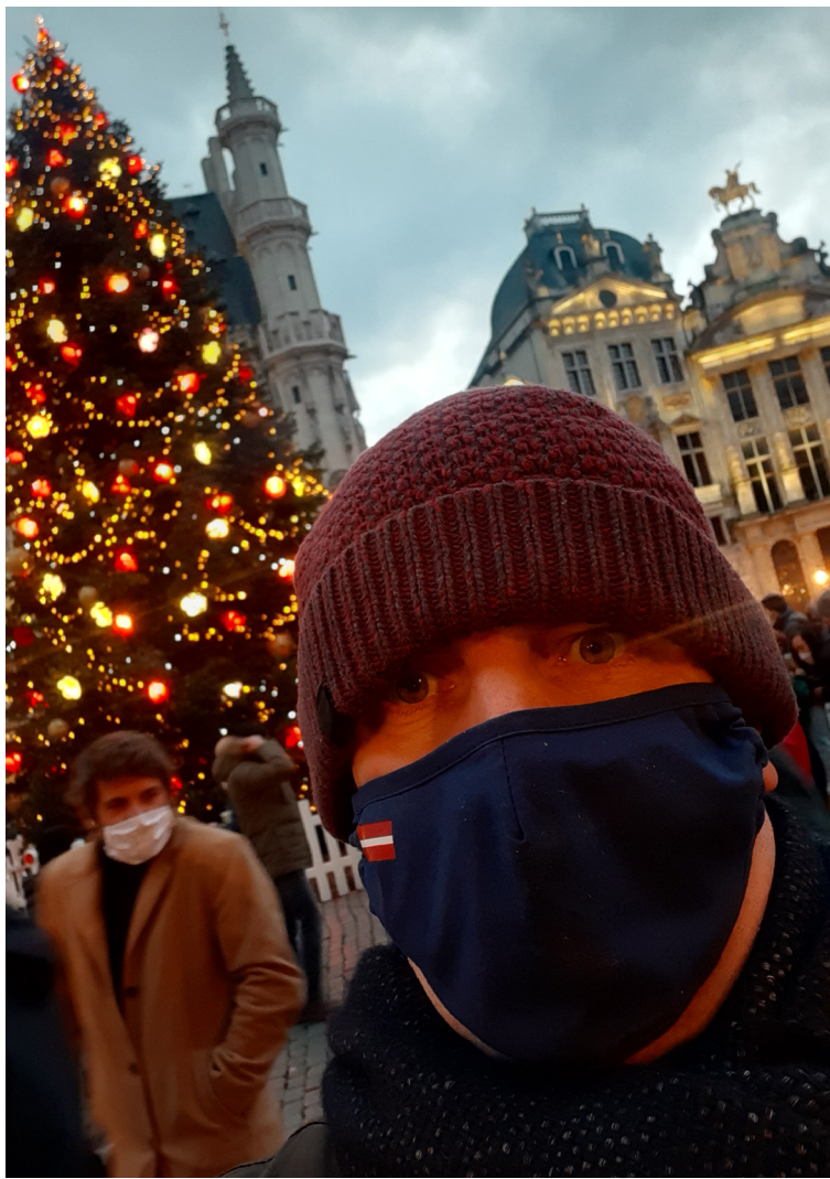
Autors Šajos Ziemassvētkos

Viss aizsākās pavisam mierīgi, kādā paklusā rudens novakarē, kad mani draugi no digitālajam aprindām pamudināja pasūtīt no tīmekļa tiešsaistē jaudīgu elektrisko grilu, kas gaļai un dārzeņiem piešķir pavisam citādu kvalitāti. Parasti esmu diezgan piesardzīgs ar iepirkumiem no dažādām vietnēm, aplikācijām, jo atšķirībā no maniem digitālajiem draugiem negribu visu dzīvi vienkārši leļupielādēt no klēpjatora. Vai laulības līgumu, piemēram, apstiprināt