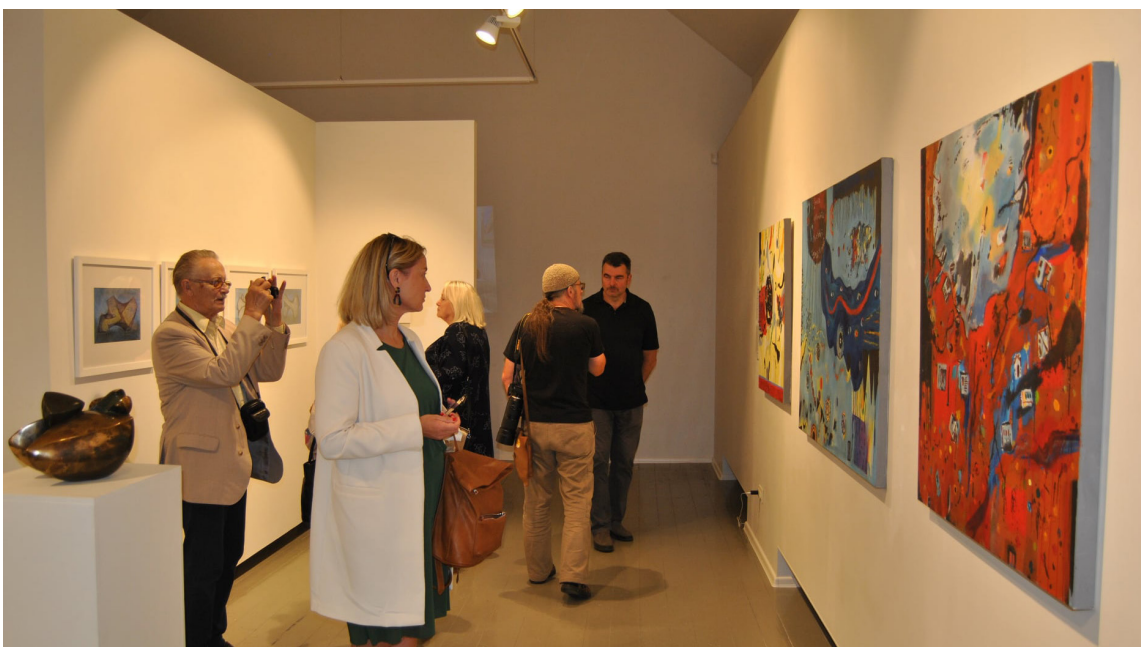
Izstāde "Pavasaris Austrālijā" Cēsīs