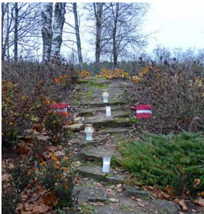
Protams, tika atzīmēta arī Latvijas dzimšanas diena.

Par godu Latvijas Valsts proklamēšanas dienai skolotāji kopā ar skolēniem iededza sveces.