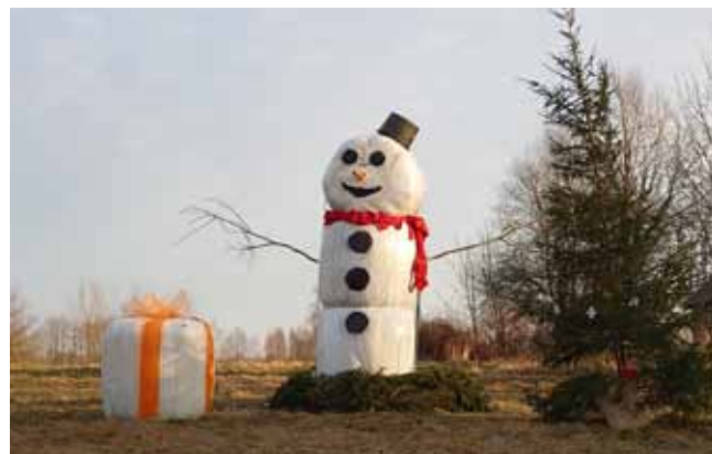
Ziemassvētku kompozīcija "Kalnājānos"