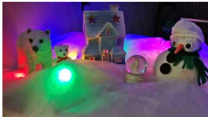
Šis gads mums pagājis vīrusa ēnā. Taču svētki ir svētki. Tie jāsvēta. Vismaz sirdī esot ar saviem mīļajiem. Īstajiem vai izsapņotajiem. Priecīgs visiem svētkus!