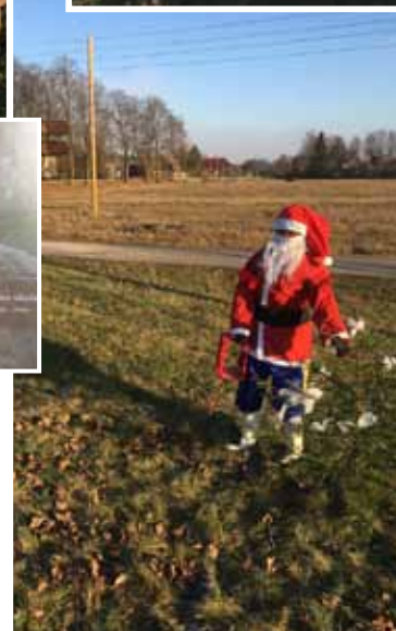
Lauras Traines foto

Kaut varētu visu dzīvi Tā viņu uz rokām nest, Uz laimi, uz spožumu, slavu Pa taisnāko taciņu vest!