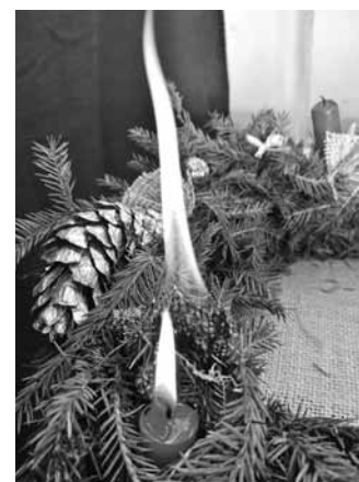
Rūpīgi jāpārdomā, kur un kā Adventes vainagu, eglīti un citus Ziemassvētku rotājumus nolikt ir droši.