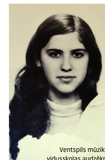
Ventpils mūzikas vidusskolas audzēkne.

„Nedomā par to, ko nevari mainīt, dari to, ko vari!” mācīja oma.