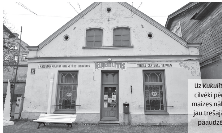
Uz Kukulītis cilvēki pēc maizes nāk jau trešajā paaudzē.

Omulīgais Kuldīgas maizes ceptuves veikaliņš Kukulītis pircējus gaida jau gadiem.