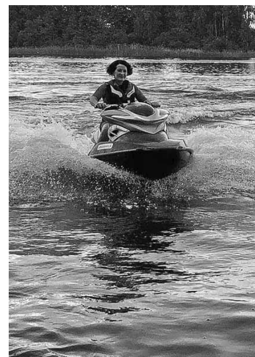
Vēl viena sirdij tikama nodarbe – braukšana ar ūdensmotociklu un ūdensslēpēm.

Kāds šis gads bijis augstskolas filiālei?