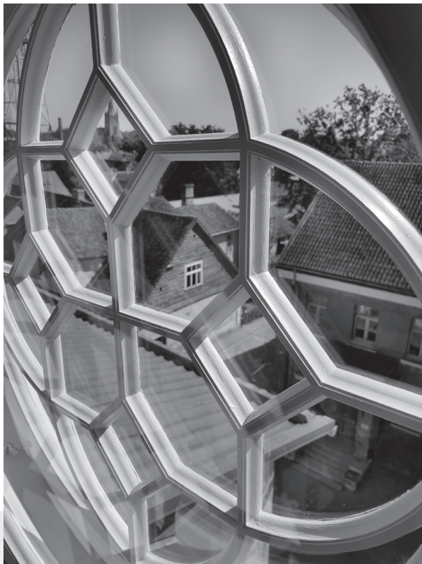
Septembrī apritēja gads, kopš Adatu tornis vēris durvis apmeklētājiem.