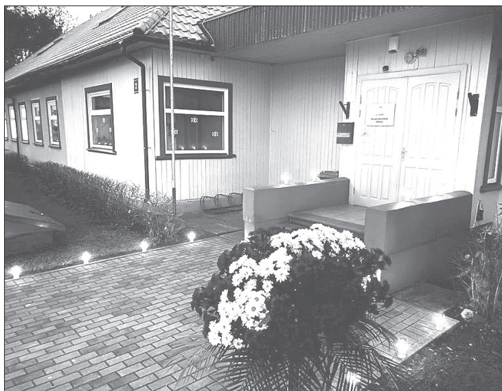
Rojas Mūzikas un mākslas skola svētku rotā. Arhīva foto

Dievs, svētī Latviju! Dievs, svētī latviešu tautu! Šogad Rojas Mūzikas un mākslas skolas izglītojamo un pedagogu sagatavoto valsts svētku koncertu varēja redzēt un dzirdēt mūsu skolas facebook lapā.