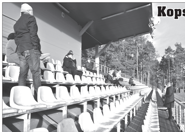
Droši vien pirmoreiz stadiona vēsturē, tā tribīnēs notika kopsapulce.