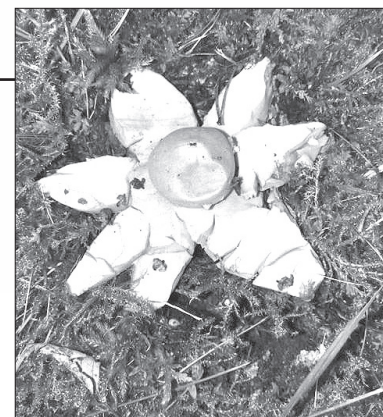
Vairums zemeszvaigzņu ir ierakstītas Sarkanajā grāmatā.

Šoruden, grābjot dārzā lapas, istu skaituli savā dārzā pamanījusi kāda rojeniece. Kā izdevās noskaidrot interneta dzīlēs, tā ir zemeszvaigzne – neliels pūpēdis ar vēl otru apvalku, kurš plīstot un atveroties, sadalās daivās, tā piešķirdams sēnei zvaigzņveida formu. Pilnībā atpletušās zemeszvaigznes caurmērs var būt 1–15 cm robežās (atkarībā no sugas). Aug rudens pusē, taču sīkstie, ādainie auglķermeņi parasti pārdzīvo arī ziemu un ir atrodami arī nākamajā pavasarī. Latvijā zemeszvaigznes ir stipri retas, tāpēc vairums ir ierakstītas Sarkanajā grāmatā un Aizsargājamo sugu sarakstā.