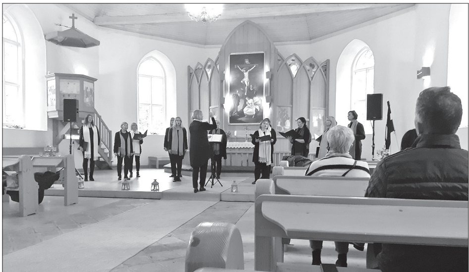
Svētku reizē dievkalpojuma dalībniekus priecēja Rojas kultūras centra sieviešu koris „Kalva”.