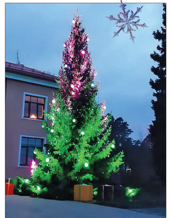
Ziemassvētki nav iedomājami bez skaistā, mūžzaļā koka.

5. decembrī laukumā pie Rojas kultūras cen- tra iemirdzējās lielā Ziemassvētku egle. Pa- saulē valdošā pandēmi- ja un valstī izsludinātā ārkārtas situācija mūsu dzīvē ienesusi dažādas korekcijas, tādēļ arī kultūras centra darbi- nieki šoreiz noteiktā laikā nepulcināja kopā visus svētku dalībnie- kus, bet gan deva iespē- ju trīs stundu garumā katram pašam sev ti- kamā laikā noskatīties, kā Rojas galvenā egle mostas svētkiem, rotā- jas un svin. Pasākumu īpaši skaistu vērsa at- bilstoši izvēlēta mūzika un baltie gaismas kūļi, kas izgaismojās aug- stu debesīs. Pie egles bija izvietots arī Rūķu pasts, un mazie novad- nieki labprāt izmantoja