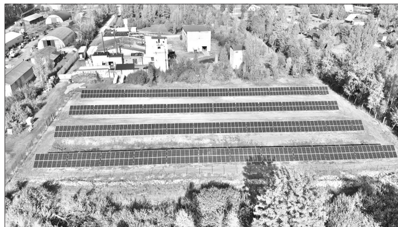
SIA „Banga Ltd” teritorijā uz zemes tika uzstādīti vairāk nekā 600 saules paneļi.

Šobrīd ražotnē ir uzsāks eksperimentāls projekts, ar mērķi roku darbu aizvietot ar robotizētu mehānismu. Tas nebūt nenozīmē, ka roboti aizstās uzņēmuma vērtīgāko aktīvu – cilvēkus, gluži otrādi – tie optimizēs darba procesu un ļaus cilvēkresursus pārvirzīt uz citiem darbiem, vienlaikus veicinot darbinieku izaugsmi un