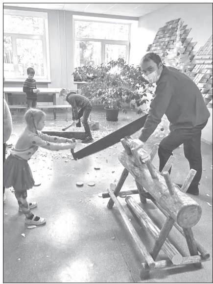
Reta iespēja bērniem – izmēģināt veco divrocī zāģi.