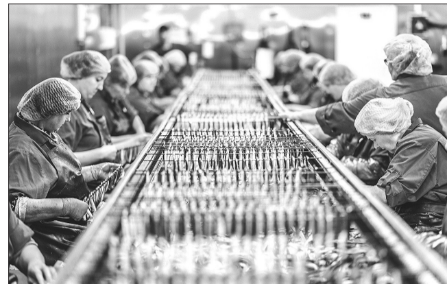
Rūpējoties par darbiniekiem, uzņēmumā ir izstrādāti dažādi motivējoši labumi.

nodrošinot konkurētspējīgāku atalgojumu, nepalielinot produkta cenu patērētājiem.