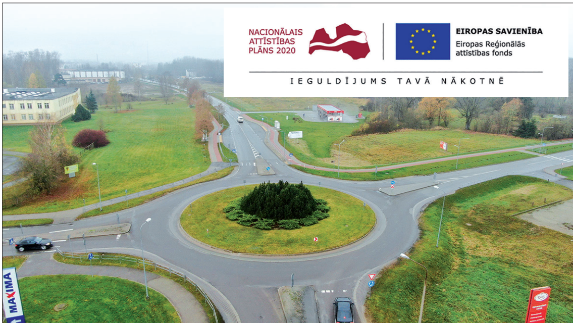
Plānotie remontdarbi ir periodiskās uzturēšanas darbi, kas nepieciešami, lai saglabātu ceļa segumu labā kvalitātē.

Aizkraukles novada pašvaldība ieguvusi Eiropas reģionālās attīstības fonda (ERAF) atbalstu projekta "Ielu infrastruktūras pielāgošana uzņēmējdarbības attīstībai" īstenošanai. Tā ietvaros paredzēta seguma atjaunošana rotācijas aplim pie lielveikala "IGA centrs", atjaunojot virskārtu un novēršot radušos iesēdumus, kā arī ap rotācijas apli esošo grāvju tīrīšanu un tajos ierīkotās meliorācijas sistēmas sakārtošanu.