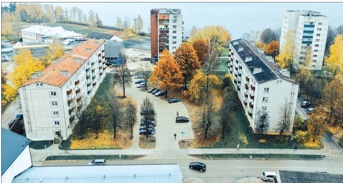
Stāvlaukums izbūvēts starp daudzdzīvokļu mājām, atstājot arī pietiekami lielu zaļo zonu. Lai stāvlaukuma izmantošana būtu ērta un droša, pie tā izvietots apgaismojums.

Spīdolas ielā starp daudzdzīvokļu mājām nr. 12 un 14 pabeigta stāvlaukuma izbūve, kuru apkārtējo māju iedzīvotāji jau sākuši izmantot automašīnu novietošanai. Stāvlaukums izbūvēts 985 m 2 platībā, tas ir klāts ar pelēka bruģa segumu, kurā iestrādātas sarkanas stāvvietu atdalošās līnijas. Jaunajā stāvlaukumā paredzēta vieta 28 mašīnu novietošanai.