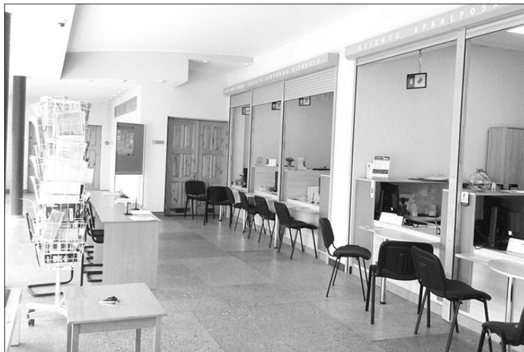
Aizkraukles Klientu apkalpošanas centrs Lāčplēša ielā 1 ir slēgts un apmeklētājus konsultē attālināti.

Paldies par atbildīgu rīcību un sapratni!