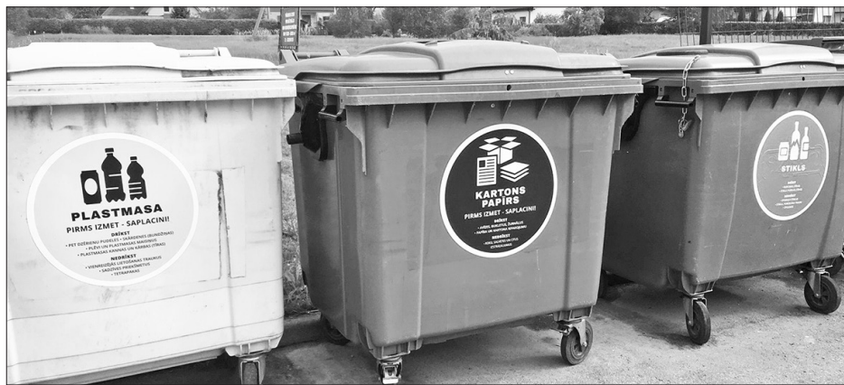
Šķirotu atkritumu konteineros drīkst mest tikai plastmasu, papīru un stiklu. Par nešķirotu un bioloģisko atkritumu izvešanu jāslēdz līgums ar atkritumu apsaimniekotāju.

Saistošie noteikumi nosaka arī to, ka dārzkopības biedrībām un garāžu kooperatīviem kā atkritumu radītājiem ir