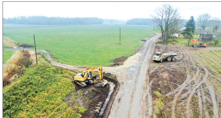
Grants ceļu atjaunošanas mērķis ir, investējot ceļu infrastruktūras kvalitātē, veicināt uzņēmējdarbību un saglabāt apdzīvotību Aizkraukles pagastā.

Aizkraukles novada pašvaldība ar Eiropas Lauksaimniecības fonda lauku attīstībai (ELFLA) atbalstu uzsākusi vairāku grants ceļu posmu pārbūvi Aizkraukles pagasta teritorijā. Tie jau ilgstoši nelabvēlīgos apstākļos bijuši grūti izbraucami un apgrūtinājuši pārvietošanos vietējiem iedzīvotājiem un lauksaimniecības tehnikai, īpaši pavasaros.