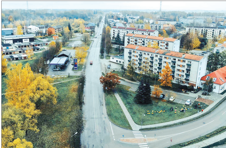
Gaismas iela norobežo pilsētas rūpniecisko zonu no dzīvojamās zonas un ir galvenā tranzīta iela, kas savieno pilsētas ziemeļu un dienvidu daļas.