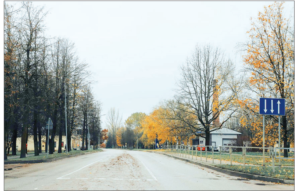
Gaismas un Mednieku ielas krustojums, no kura atsākas Gaismas ielas rekonstrukcija pēc iepriekšējā būvdarbu etapa pabeigšanas 2019. gadā.

Novembra sākumā Gaismas ielā, Aizkrauklē uzsākti vēl viena šīs ielas posma rekonstrukcijas būvdarbi. Paredzēta ielas nesošās konstrukcijas un seguma pārbūve, ietju pārbūve un izbūvēšana, kā arī jauna apgaismojuma uzstādīšana un lietus kanalizācijas izbūve. Rekonstrējams posms sākas krustojumā ar Mednieku ielu no vietas, kur tika pārtraukti iepriekšējie Gaismas ielas atjaunošanas darbi pagājušā gada rudenī, un noslēdzas aiz kultūras nama starp Dzelzceļa un Norkalnu ielu.