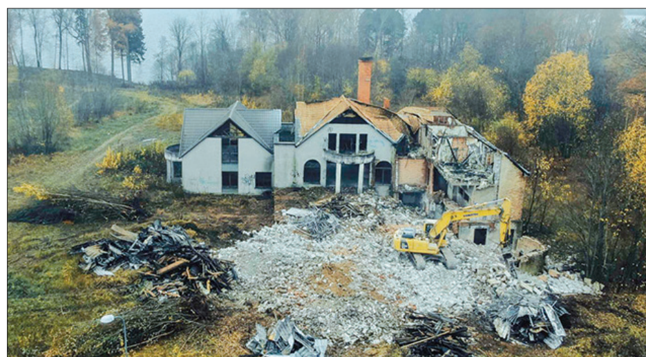
Sakopto teritoriju plānots piedāvāt investoriem, kurus varētu interesēt attīstīt uzņēmējdarbību skaistā vietā pie Daugavas.

kārtoti, konstatējot, ka jaunbūves tehniskais stāvoklis turpina pasliktināties, tā nav nodrošināta pret nepiederošu personu iekļūšanu tajā un netiek pienācīgi apsaimniekota un uzturēta. Turklāt jaunbūves esošais stāvoklis rada reālu apdraudējumu cilvēku drošībai un de-