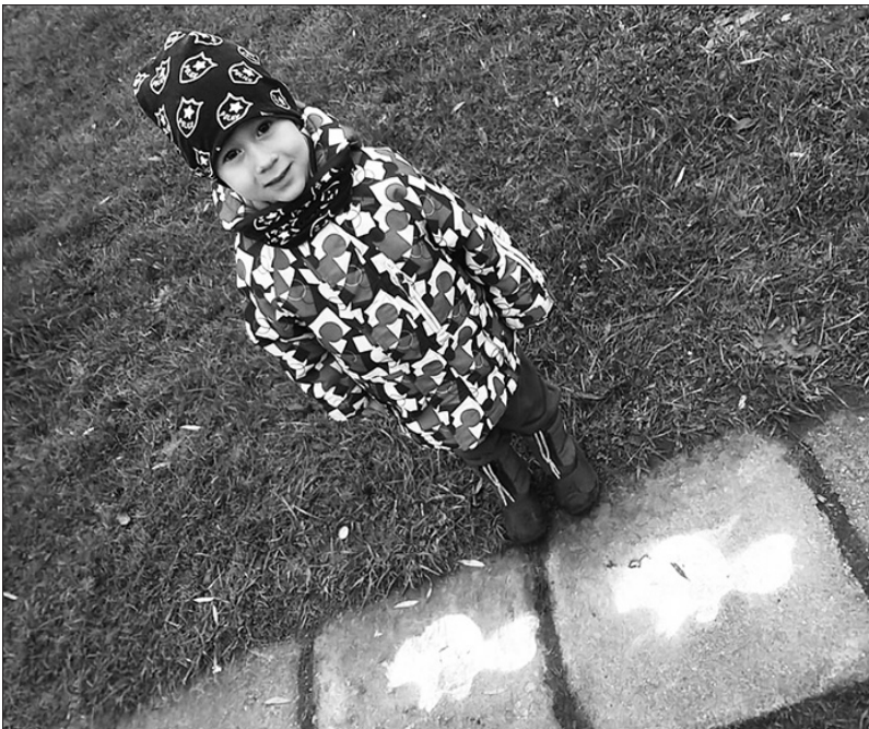
Ozolu-Maškovu ģimenes jaunākais dalībnieks pie viena no orientēšanās aktivitātes kontrolpunktiem.