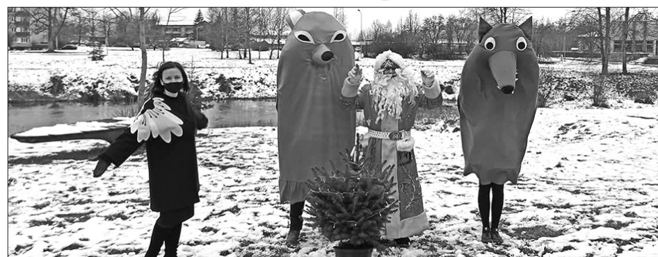
Par iespēju satikt Ziemassvētku vecīti un saņemt dāvanas priecājas ikviens!