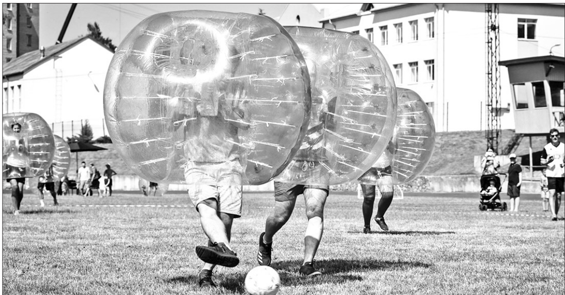
Šogad organizētas arī dažādas sporta sacensības; atraktīvākās noteikti bija pirmo reizi notikušais Aizkraukles kauss zorb futbolā jeb burbuļfutbolā.