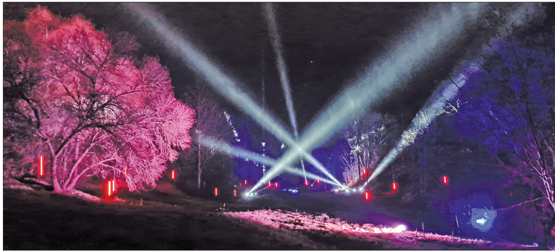
Gaismas un mūzikas saspēle radīja īpašu un patriotisku noskaņu.