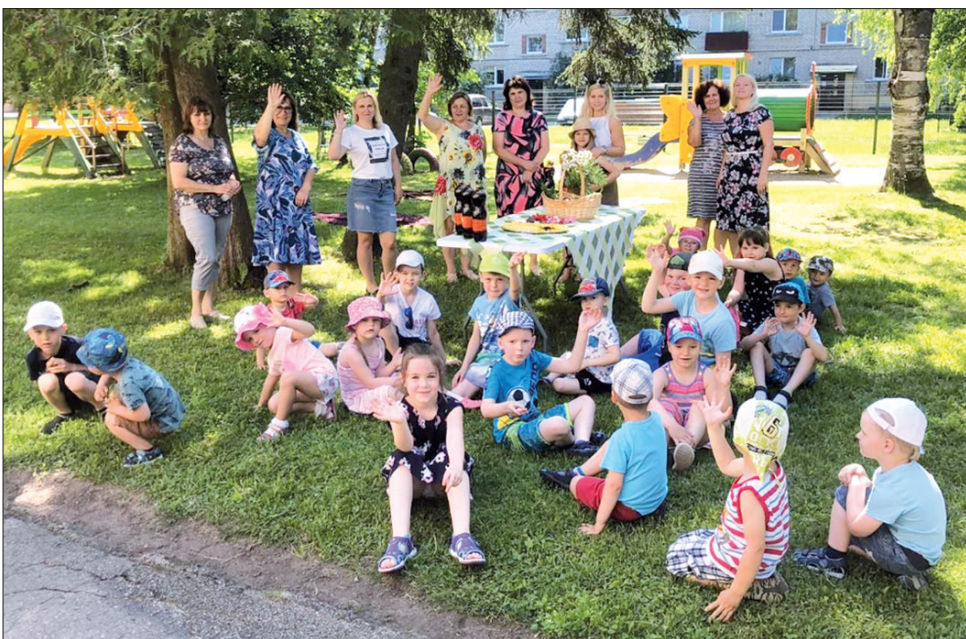
Kopā ar skolotājiem bērni apgūst arī latviešu svētku svinēšanas tradīcijas.

Lai nākamajā gadā mums visiem laba veselība, daudz pozitīvu notikumu un domu, miers dvēselē, lai mēs visi vienkārši LAIMĪGI būtu! Lai mēs dzīvotu Mīlestības mājā uz Saticības ielas un logi būtu plaši pavērti uz sapņu dārzu, un šie sapņi lai piepildās!