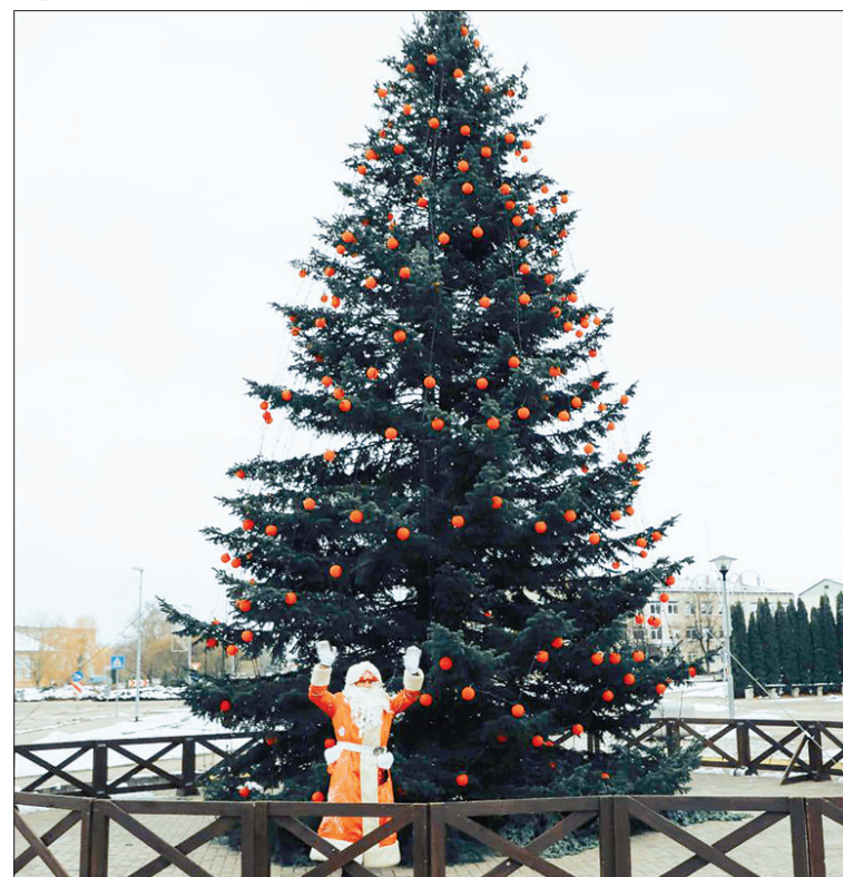
Lai mirdz! Lielā pilsētas egļu uzposta svētkiem.