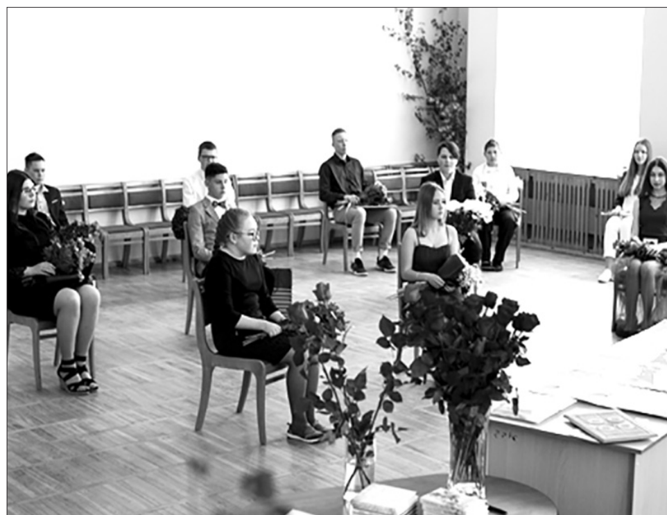
Daļa mūzikas skolas absolventu šī gada izlaidumā.