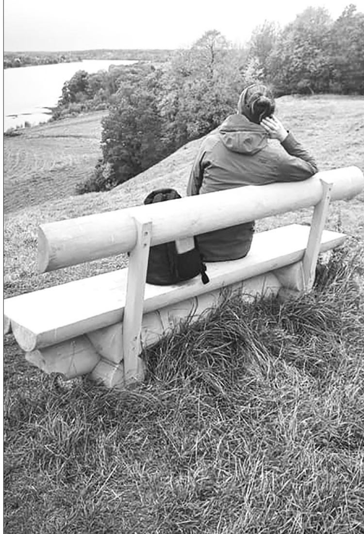
Šogad īpaši pieprasīti bija pārgājieni Daugavas ielejas dabas parkā.