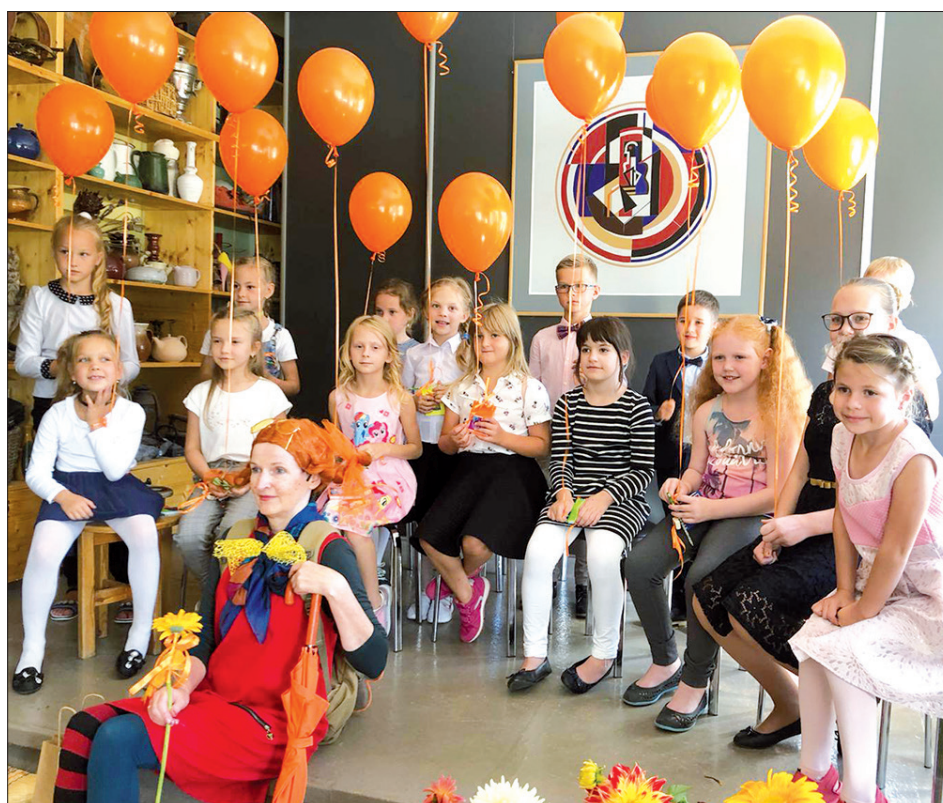
1. septembra pasākums "Oranžais mākonis" pulcē topošos māksliniekus.

Nākamajā gadā turpināsim radoši līdzdarboties skolas un pilsētas tēla veidošanā, realizējot gan mācību prog-