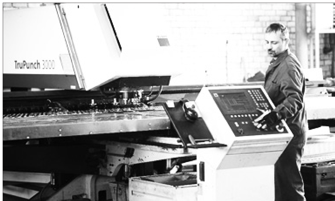
SIA "Metālists" investējis augstas kvalitātes vācu uzņēmuma iekārtu iegādē, lai varētu nodrošināt teicamu produkciju.

Zemgales Plānošanas reģions (ZPR) piekto reizi organizēja konkursu "Gada uzņēmējs Zemgalē – 2020". Laureātu godināšanas pasākums tika plānots Rundāles pilī 27. novembrī, bet ZPR nolēma apbalvojumu pasniegšanu organizēt pēc valstī noteiktās ārkārtējās situācijas beigām un pulcēšanās ierobežojumu atcelšanas.