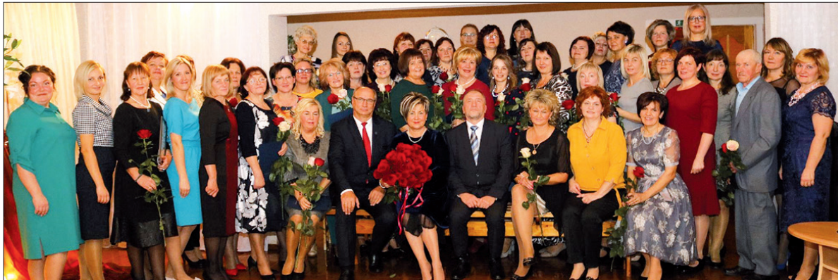
Protam bērnu acīm raudzīties un ticam labajam, tie esam mēs – "Auseklītis" strādājošie!