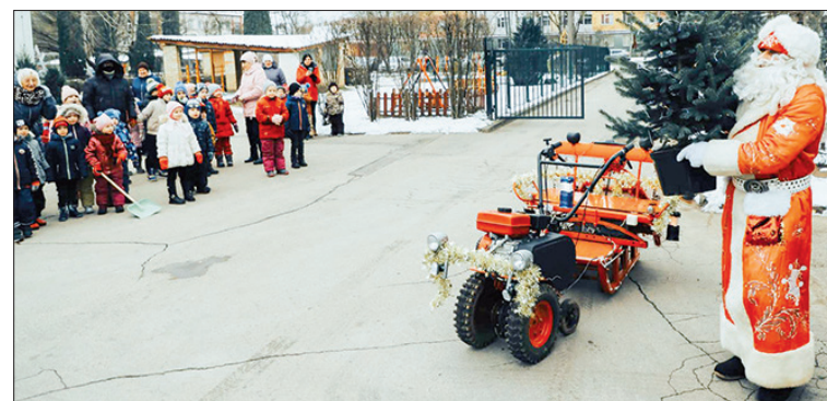
Ziemassvētku vecītis pie bērniem ieradās īpašās kamanās un, protams, ar dāvanu.

Gaišu, baltu un veselīgu šo Ziemassvētku gaidīšanas laiku!