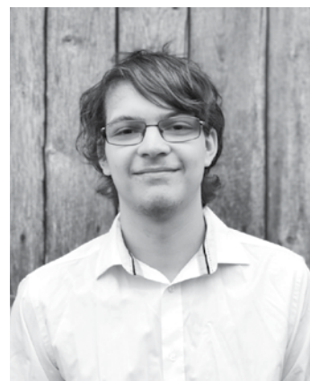
Gatim Dvilaitim lielākais pārsteigums bijusi Amerikas Latviešu apvienības stipendija.

Grūti iet tiem, kam patīk uzturēties ārpus mājās, izklaidēties. Mani tas tik ļoti neietekmē. Tomēr labākās atziņas, ko esmu guvis: nesatraukties par