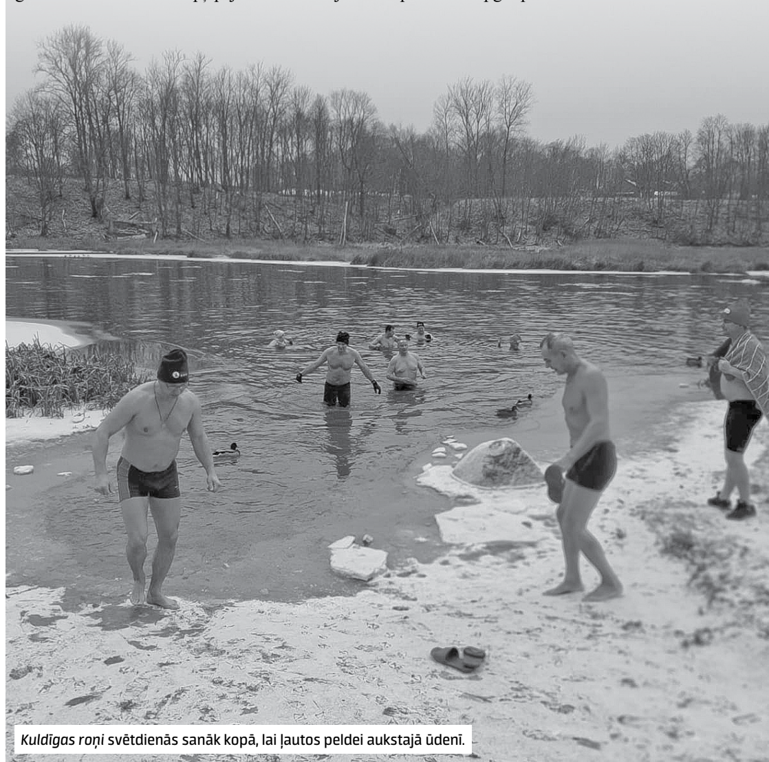
Kuldīgas roņi svētdienās sanāk kopā, lai ļautos peldei aukstajā ūdenī.

Iesācējiem nav sevi jāizaicina un jācenšas uzreiz ūdenī pavadīt ilgu laiku. Jāsāk pamazām un rāmi. Jāuzmanās no ledus – par to mani brīdināja pieredzējušie ziemas peldētāji. Ledus ir kā žilete, kas skrāpē kājas. Kad esi ūdenī, tad nejūti, ka kājas saskrāpētas. To jūt tikai tad, kad sasilst. Tad var būt ļoti nepatīkami.”