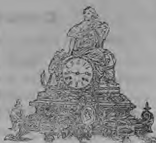
Rudbiga. Junija meh. 1881.