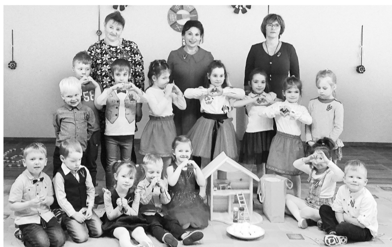
Latvijas dzimšanas dienu svinot grupa „Bitītes”.

Nākamajā nedēļā, atstājot maskas mājās, visi tērpušies svētku drēbēs atzīmējām 102. Latvijas dzimšanas dienu. Skolotāja Zaiga ar grupu skolotājām iestādes zālī bija pārvērtušas par savdabīgu muzeju, kurā atradās vieta izstādei no mūsu vecmāmiņu pūra lādes, kurā glabā-