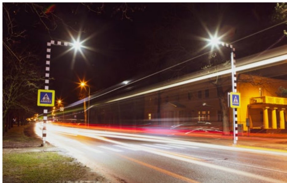
Gājēju pāreju apgaismojums Baložos.