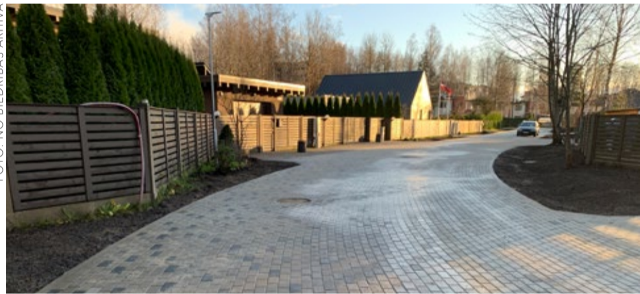
Lāču ielā izbūvētais bruģa segums.