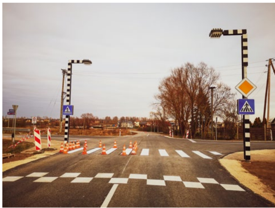
Paceltais krustojums V2 un Pļavniekkalna ielas krustojumā.