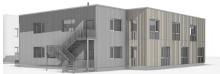
Bērnudārza piebūves vizualizācija.

Lai būvniecības laikā nodrošinātu būvmateriālu piegādi un būvtechnikas piekļuvi pirmsskolas izglītības iestādei „Ieviņa”, darbdienās no plkst. 7.00 līdz 17.00 ir ierobežota automašīnu apstāšanās un stāvēšana piebraucamajā ceļā starp Gaismas ielu 25 (bērnudārzs „Ieviņa”) un daudzdzīvokļu mājām Gaismas ielā 19, k. 8, k. 11 un k. 12, informē Ķekavas novada pašvaldības Attīstības un būvniecības pārvalde.