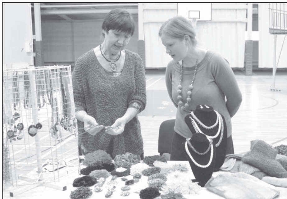
Viens no 19 Ziemassvētku tirdziņa tirdzniecības stendiem, kurā varēja iegādāties rotaslietas, siltas zeķes, cimdsus un cepures