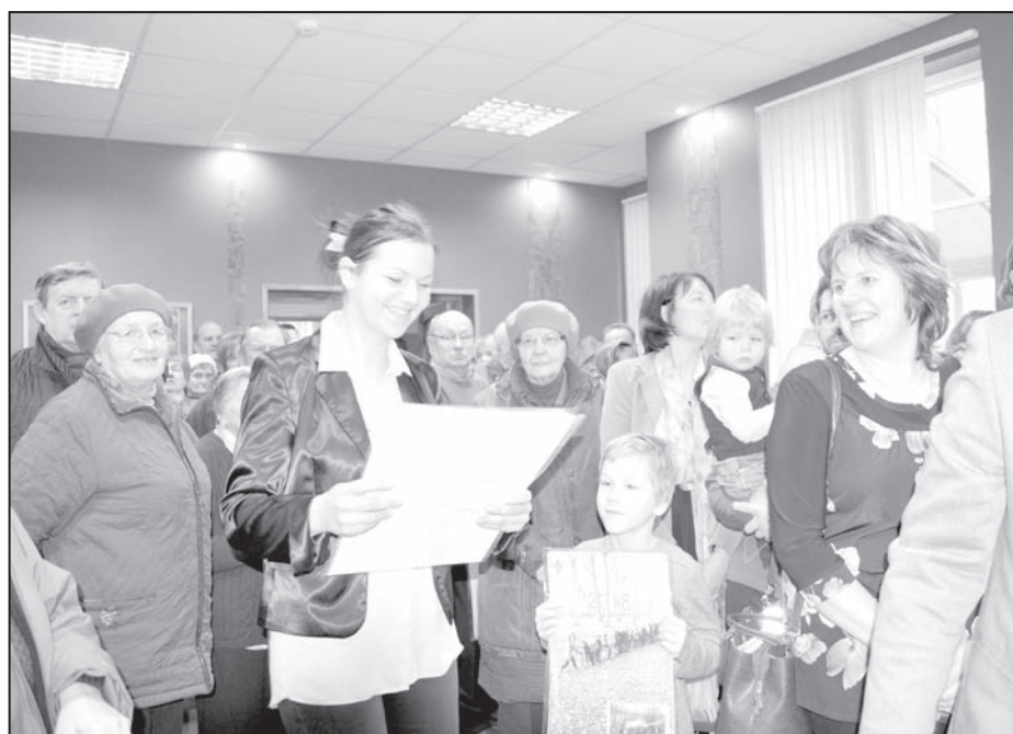
Ikviena ir priecīga ieraugot savu dzimtu kalendāra fotogrāfijās, kuras šeit dzīvojušas piecās, sešās un vēl vairāk paaudzēs.

Darbu novērtējis Latvijas valsts simtgades birojs – šo projektu pre-