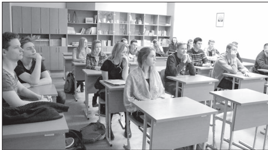
12.klases skolnieki konferences laikā piedalījās izglītojošās lekcijās-nodarbībās vidusskolēniem par karjeras izglītības tēmām

Paldies projektā iesaistītajiem skolotājiem, konferences dalībniekiem un mācībspēkiem, Ziemassvētku tirdziņa dalībniekiem! Šajā Ziemassvētku gaidīšanas laikā skolotājiem bija iespēja ieklausīties, padomāt, pārdomāt, ko un kā es daru savā ikdienas darbā, ko varu darīt labāk. ☘