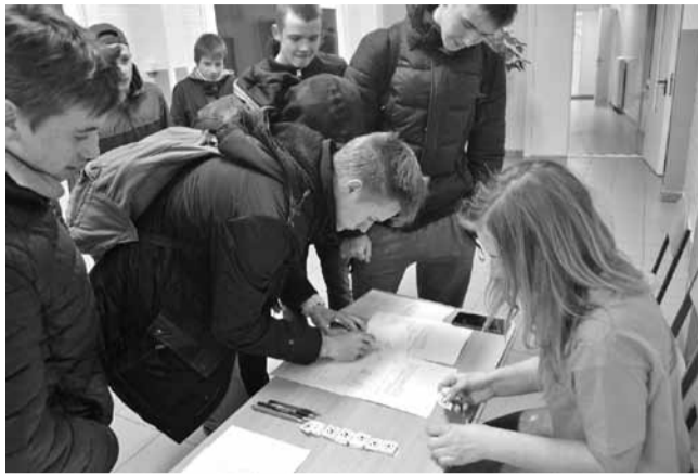
Krustpils novada atklātais telpu futbola nakts čempionāts

Man patīk redzēt cilvēku emocijas, kad viņiem palīdz un neko neprasa pretī. Patīk, kad gan mazi bērni, gan vecāka gada gājuma cilvēki ir smaidīgi un gatavi komunicēt ar citiem.