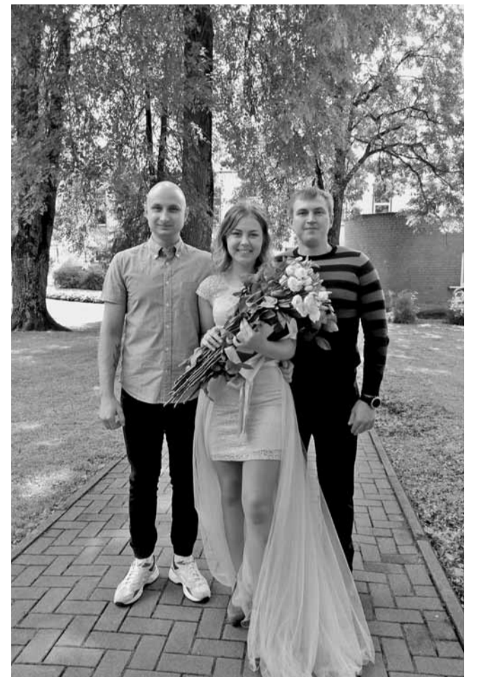
Ar brāļiem absolvējot Jēkabpils valsts ģimnāziju

Mani iedvesmo cilvēki, kas ir man apkārt. Mēs katrs esam dažādi un katram ir kaut kas īpašs ar ko iedvesmot citus. Mēs katrs varam būt kā paraugs kādam un dot motivāciju.