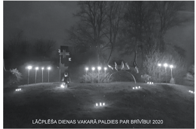
Saukas ciemata centrs Lāčplēša dienā tika izgaismots ar lāpām un svecītēm.