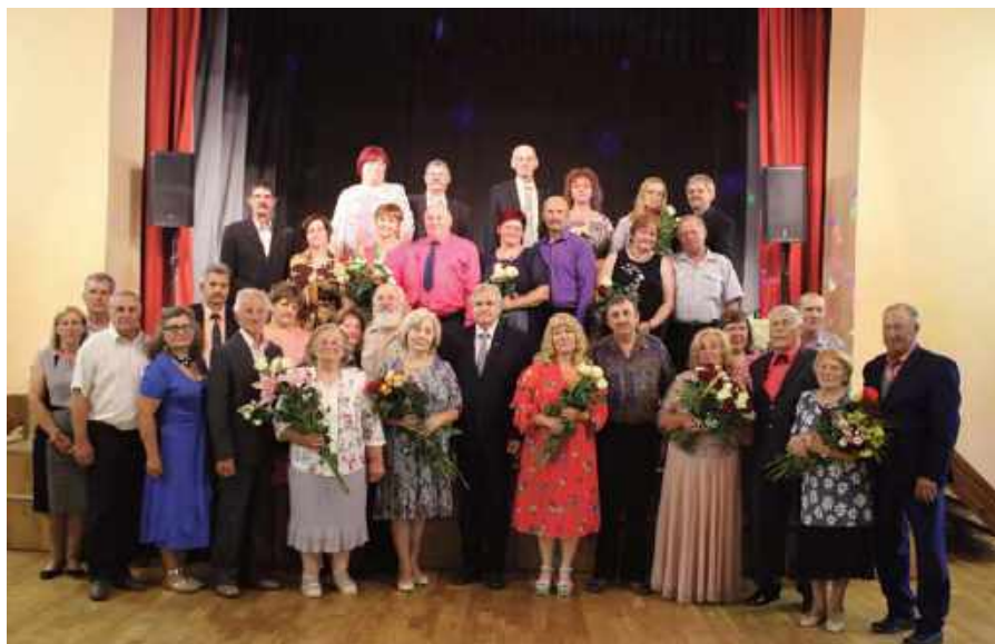
Novada svētkos sveica tos pārus, kas laulībā nodzīvojuši divdesmit piecus un vairāk gadu