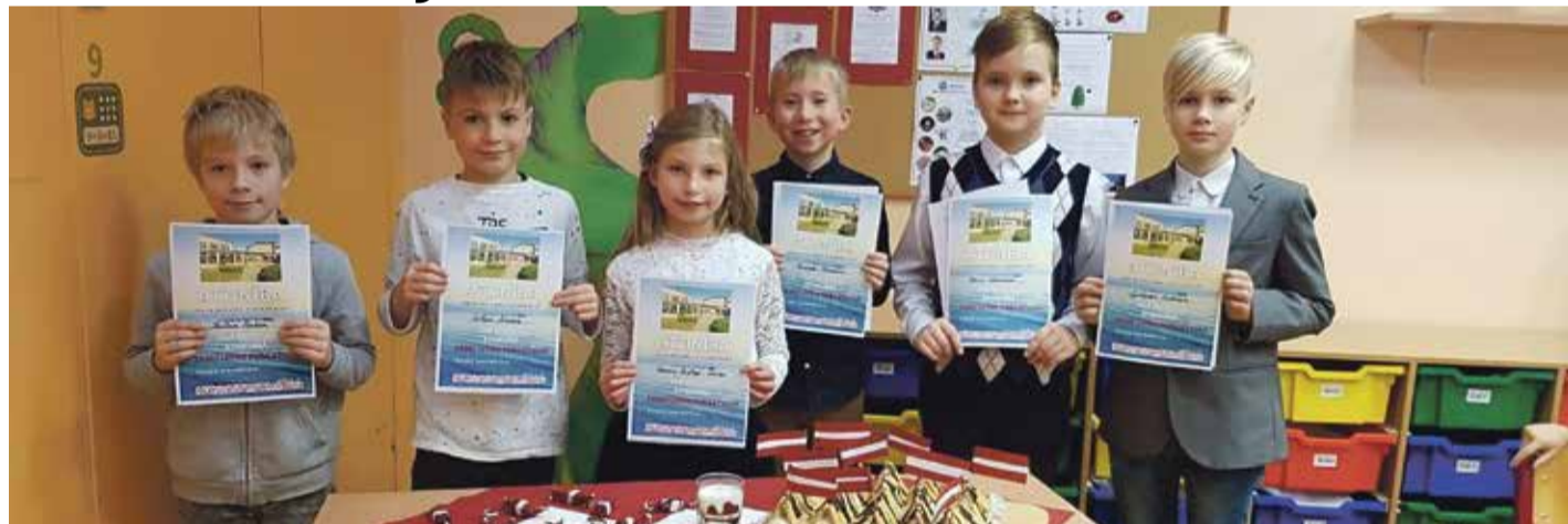
Zvejniekciema vidusskolas 3. klases audzēkņi.

Šogad bija rudenīgs novembris, kas ne tikai Latvijas valsts svētku dienās, bet visu patriotisko mēnesi vedināja pārdomāt: kas mūs vieno – vēsture, valoda, zeme? Bet varbūt kopīgi paveiktais? Mēs Zvejniekciema vidusskolā šogad īpaši izjutām, ka dzimtenes mīlestība sākas ģimenē ar vecāku un vecvecāku stāstiem par sasniegto, ar rūpīgi glabātām fotogrāfijām par savu ģimeni, dzimto novadu un valsti.