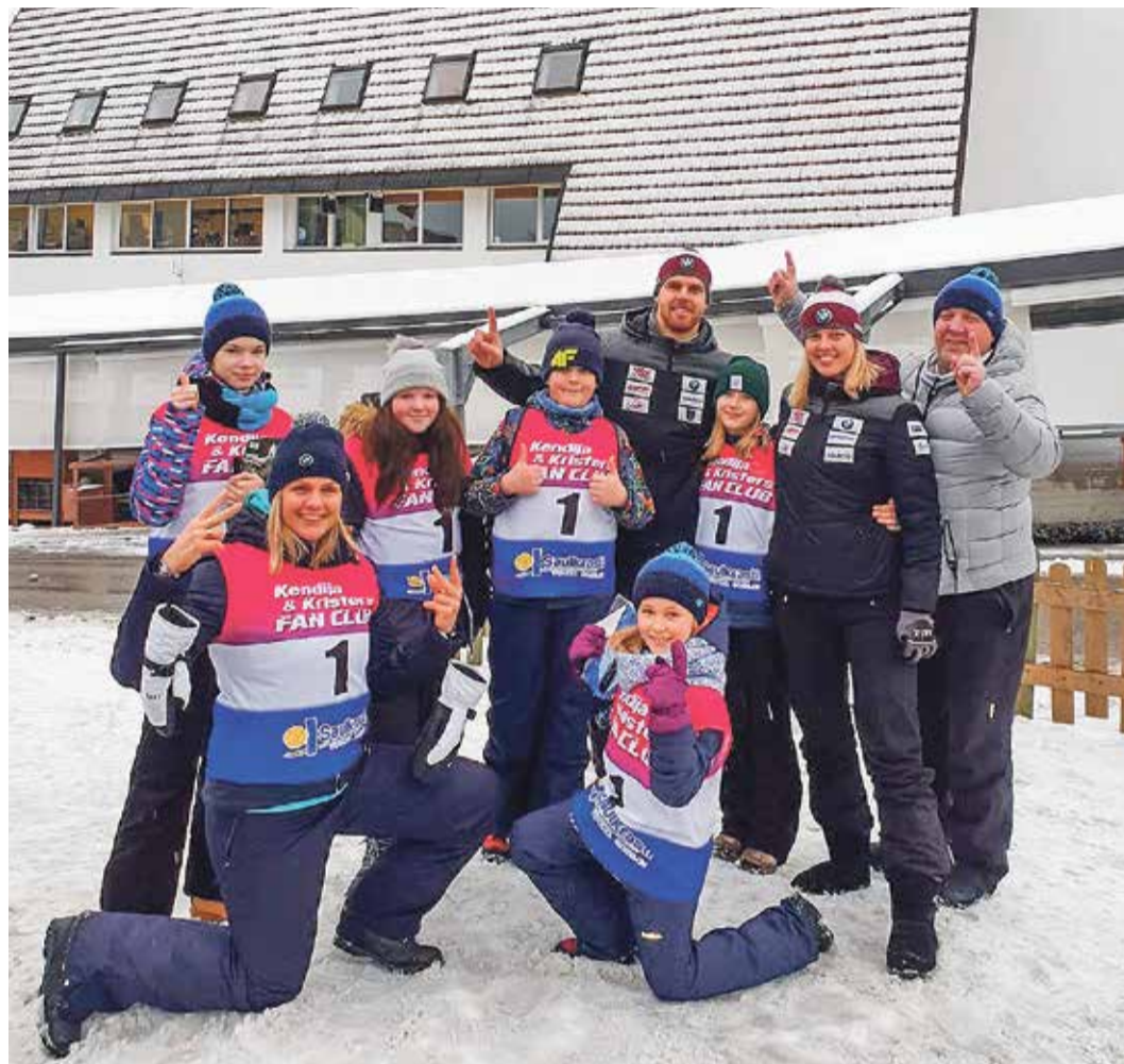
Kopā ar visu ģimeni un mazajiem kamaniņu sporta audzēkņiem no Saulkrastu grupas Pasaules kausa sacensībās Siguldā 2019. gada janvārī.

Būtiski, ka šī ēka jau sākumā tika būvēta par sporta un atpūtas centru — tas ir tikai apsveicami, ka šogad pašvaldība pieņēma drosmīgu lēmumu un nodeva ēku apsaimniekošanā mums. Jā, mēs plānojam nelielu peldbaseinu, pirti, dažādu cīņu ringa izveidi un fitnesa zāli, ko