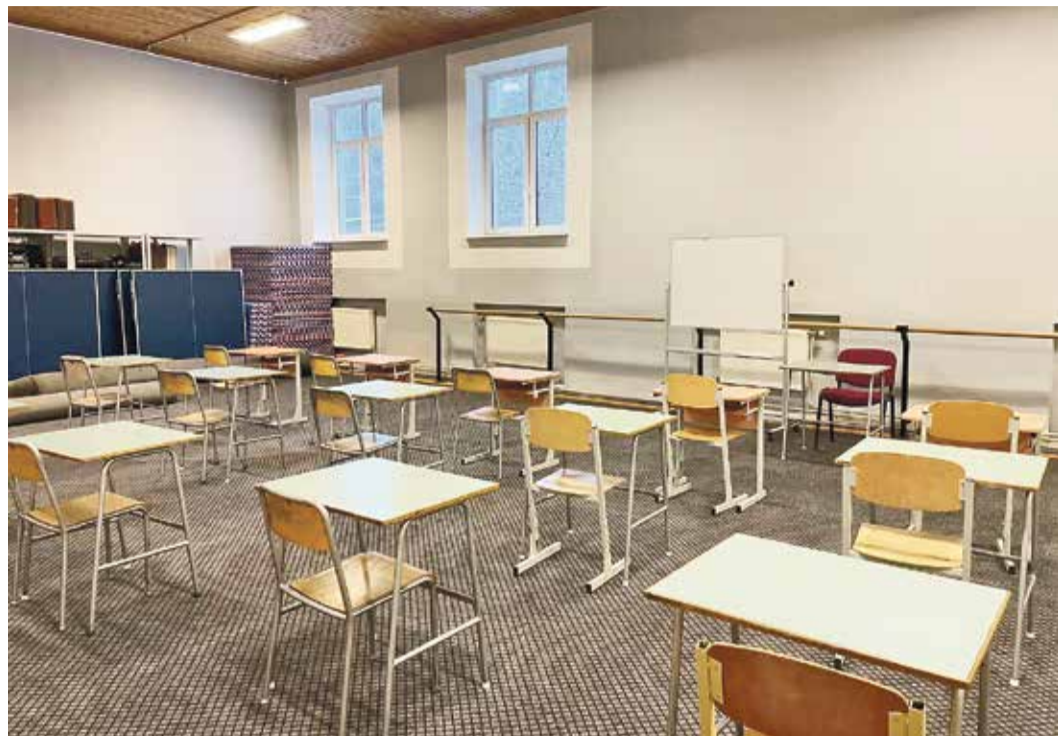
Lai audzēkņiem nodrošinātu valdības noteikto distancēšanos, Saulkrastu vidusskolas sporta zāle pielāgota atbilstoši jaunajām prasībām.