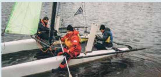
Saulkrastu pilsētai jauns video!