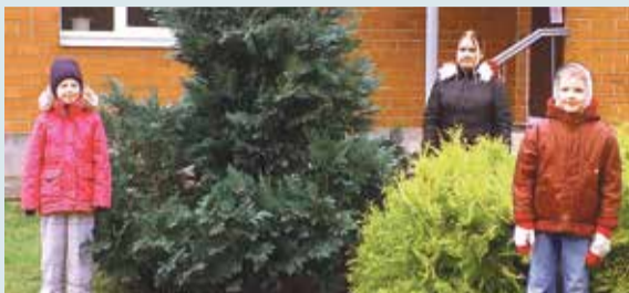
VJMMS audzēkņiem konkursos labi rezultāti