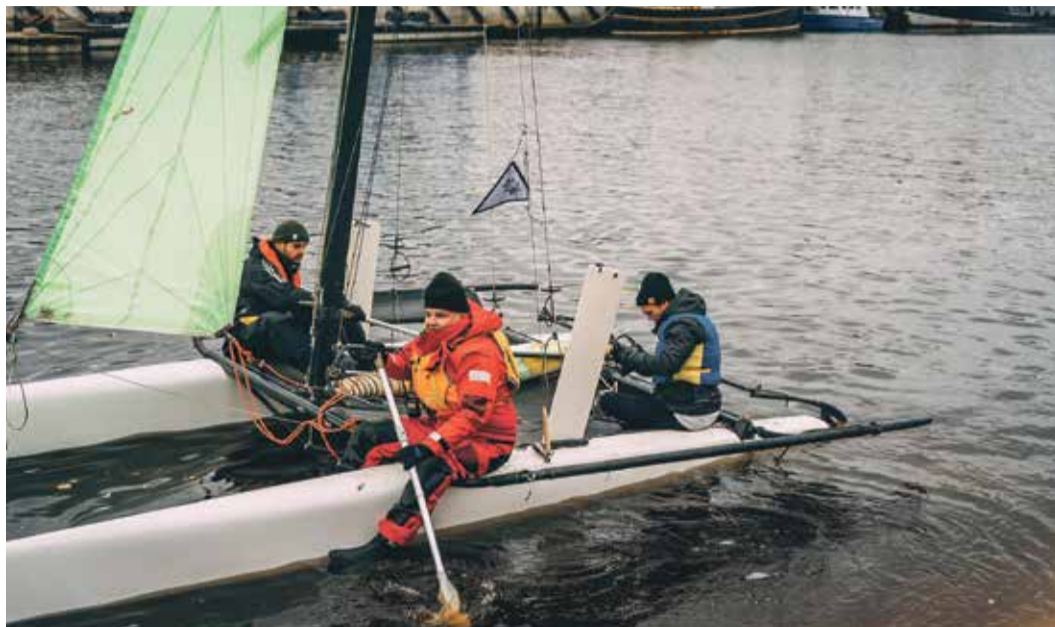
Filmēšanas dienā vējš lika sevi manīt tik ļoti, ka katamarāna komandai (aktierim, operatoram un stūrmanim) nācās mainīt maršrutu un pietuvoties krastam pēc iespējām, nevis paredzētā plāna.