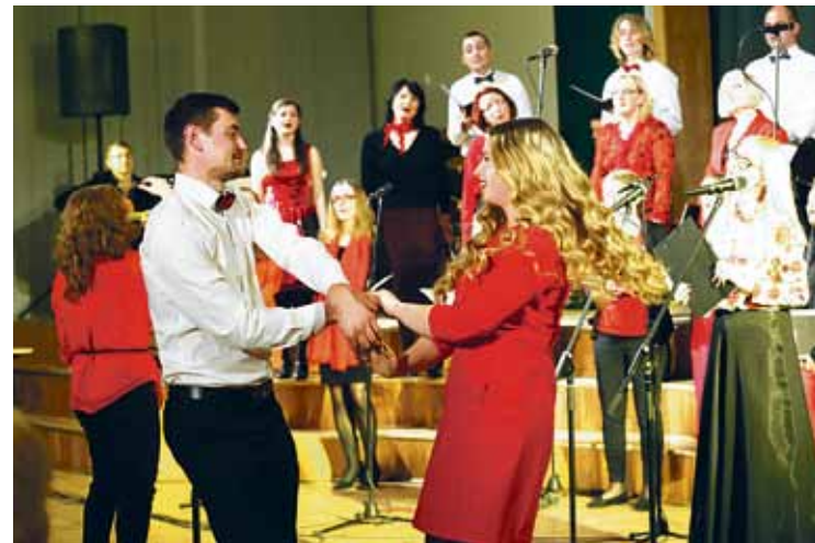
Mirkļis no koncerta „Mīlestības dziesmas”.

Ķekavas novadā februāris kultūras programmā iezīmējās ar daudzveidīgiem pasākumiem, kas tika veltīti mūžīgi skaistajai un smeldzīgajai mīlestības tēmai.