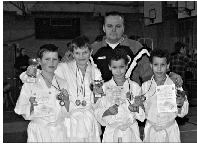
No privātā arhīva

Šī gada februāra beigās Rīgā notika trešais Latvijas TaeKwonDo kausa iesācējiem. Līdzīgi kā agrāk tajā piedalījās daudz sportistu no deviņiem klubiem visā Latvijā. Kopā piedalījās aptuveni 90 sportistu dažādās vecuma grupās.