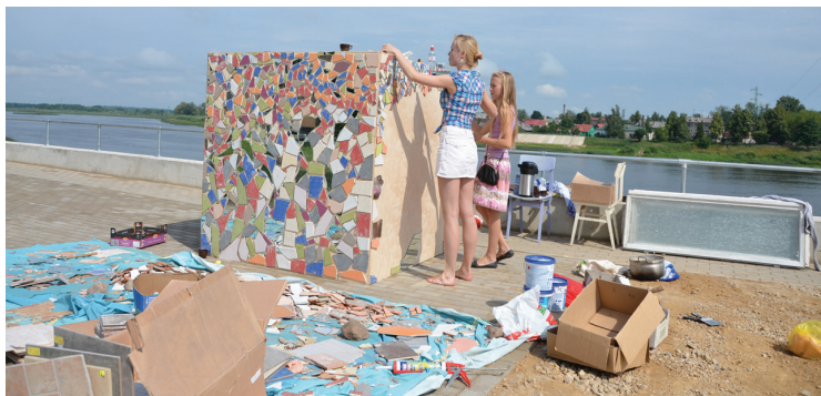
Vairāki no mākslas performancē „Sutka” tapušajiem darbiem bija apskatāmi arī pēc performances noslēguma