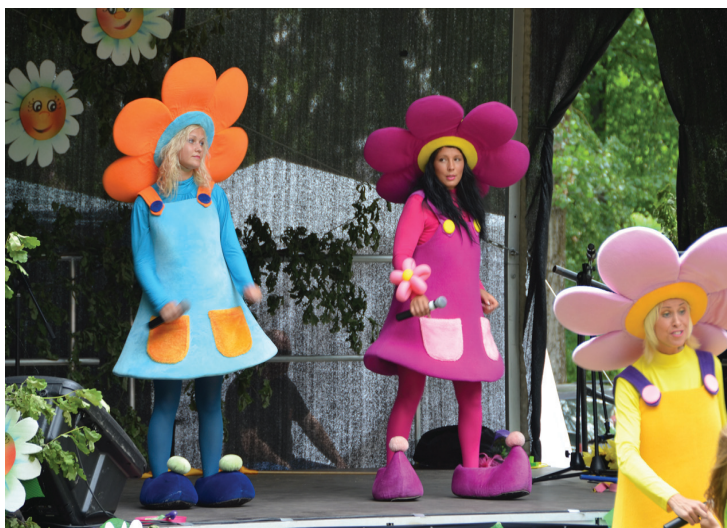
Pilsētas svētkos Kena parkā mazos jēkabpiliešus priecēja koncerti, atrakcijas un dažādas aktivitātes visas dienas garumā.