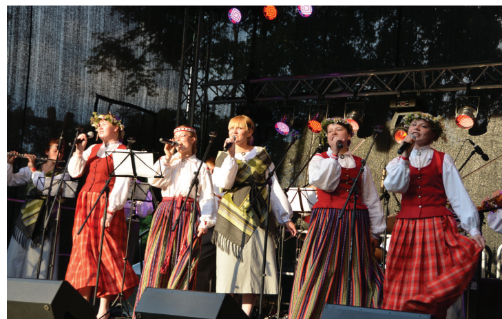
Jau piekto gadu Jēkabpilī norisinās tautas mūzikas festivāls „Lustes Jēkabpilī”