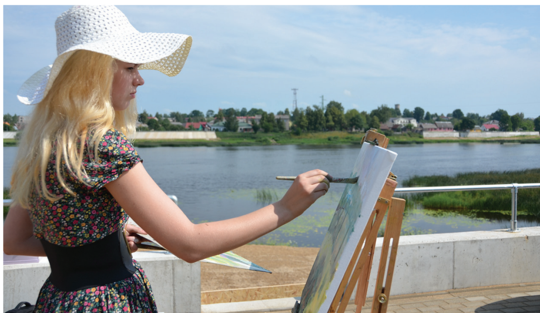
Ieskandinot pilsētas svētkus, diennakts garumā uz Jēkabpils aizsargdambja tapa 24 mākslas darbi.