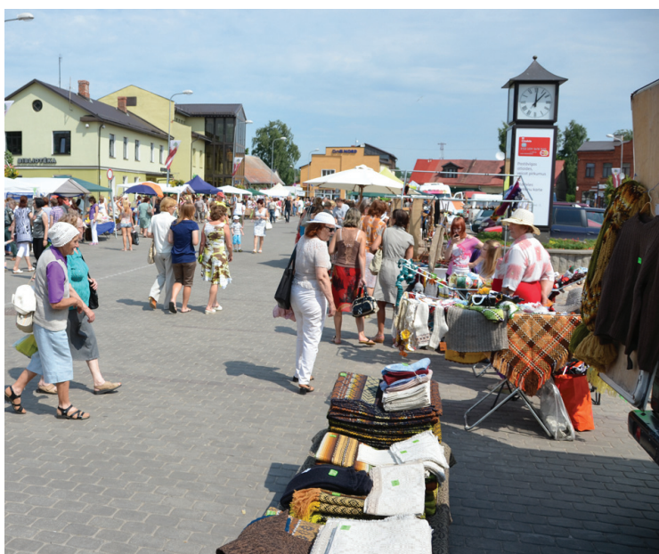
Pilsētas svētkos šogad norisinājās piektdienas tirgus, ko pašvaldība iecerējusi iedibināt kā ikgadēju tradīciju.