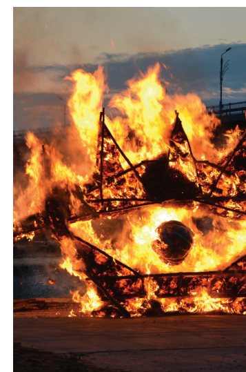
Mākslas performances „Sutka” ietvaros Daugavas malā tapa instalācija „Uguns acs”.