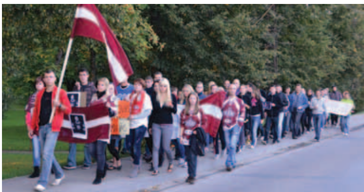
9. septembrī daudzi jēkabpīlieši devās latviešu hokeja aizsarga Kārļa Skrastiņa piemiņas gājienā no t/c "Jēkabpils centrs" līdz "Dinamo Rīga" fanu klubam.