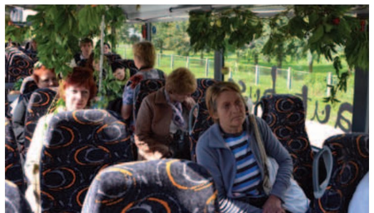
Dzejas dienu ietvaros tika organizēts arī "Dzejas autobuss". Šoreiz autobusā dzeju varēja ne tikai lasīt, bet arī paņemt līdzi.