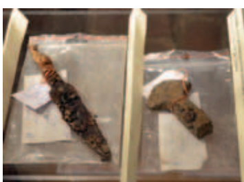
Ekspresizstādē "Arheoloģiskie atradumi. Jēkabpils 2011" septembrī bija unikāla iespēja skatīt senlietas, kas atrastas, veicot rekonstrukcijas darbus Rīgas un Brīvības ielās. Priekšmeti, kas atrasti pie Krustpils pils, datējami ar 13.–19. gadsimtu, bet Jēkabpils pusē atrastās lietas – ar 15.–19. gs.