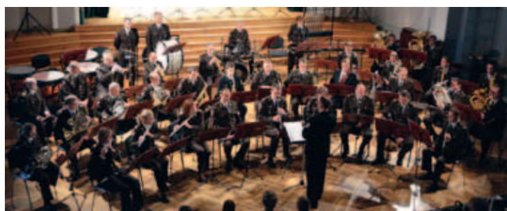
16. septembrī Nacionālo bruņoto spēku orķestris Jēkabpils tautas nama Lielajā zālē atklāja jauno koncertsezonu. Sezonas atklāšanas koncertā skanēja tikai latviešu mūzika. Tas bija veltījums latviešu komponistiem, kuriem šogad aprit apaļas jubilejas.