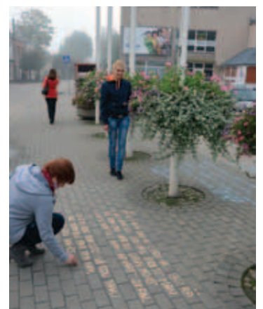
Septembrī Jēkabpils pilsētā notika arī Dzejas dienu pasākumi. Visas dienas garumā pilsētā norisinājās akcija "Sirds uz trotuāra". Jau no agra rīta uz ietves Brīvības ielā, iepretim Jēkabpils pilsētas pašvaldībai, kā arī uz Pasta ielas ietves tika rakstūta dzeja.