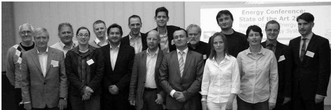
Jēkabpīlieši Norvēģijā guva vērtīgu pieredzi enerģētikas jomā

Horvātu enerģētikas aģentūra prezentēja pasīvo māju, kura ar aģentūras atbalstu uzbūvēta Koprēvnicas pilsētā, un ielūdza klātesošos uz enerģētikas konferenci