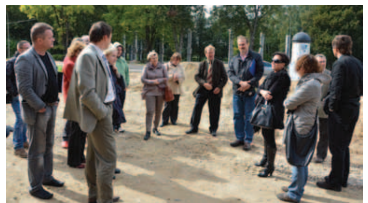
14. septembrī Jēkabpilī notika izbraukuma seminārs, ko rīkoja SIA "Vides investīciju fonds". Tā nolūks bija iepazīt labākos Latvijas mēroga labas prakses piemērus, t. i., projektus, kuri tiek realizēti ar Eiropas Reģionālā attīstības fonda un Kohēzijas fonda līdzfinansējumu. Viens no četriem objektiem Zemgales reģionā, kuru bija izvēlēts apmeklēt semināru ciklā, bija Krustpils kultūras nams.