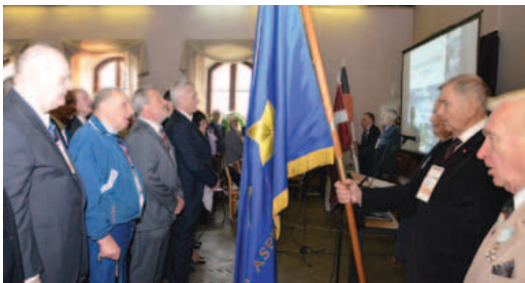
3. septembrī Jēkabpils Vēstures muzejā norisinājās ar Latvijas ordeņiem un to Goda zīmēm apbalvoto 13. salidojums.