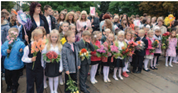
Jēkabpils pilsētas izglītības iestādēs šogad septembrī mācības uzsāka 2782 skolēni.