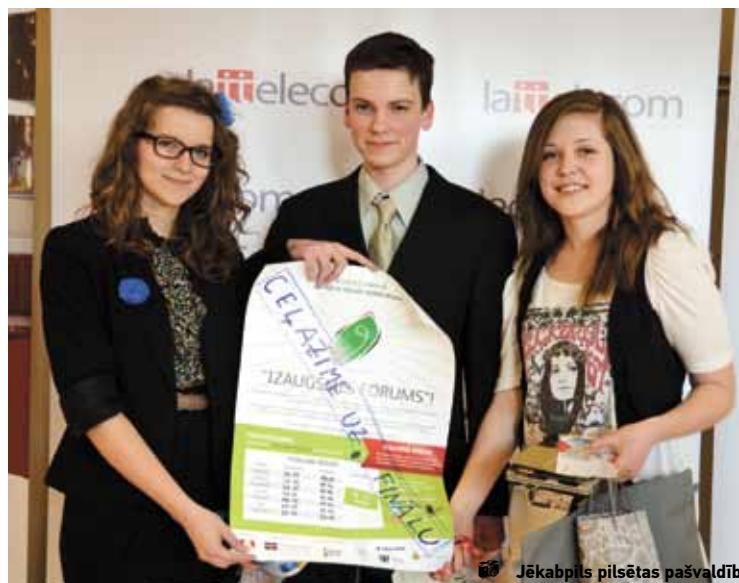
Jēkabpils pilsētas pašvaldība