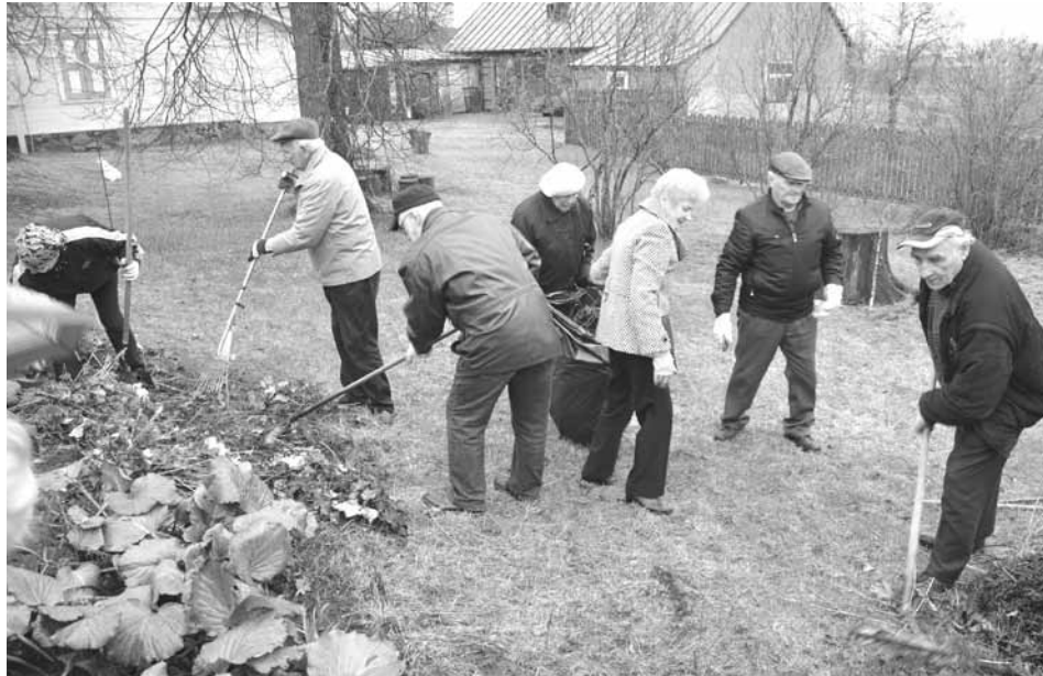
Pensionāri pie biedrības ēkas aktīvi talkoja arī šopavasār

Jau vairāk nekā 10 gadus pilsētas pensionāru apvienība, bet Jēkabpilī darbojas Jēkabpils ba. Sākotnēji tā pastāvējusi vēlāk tika nodibināta biedrība