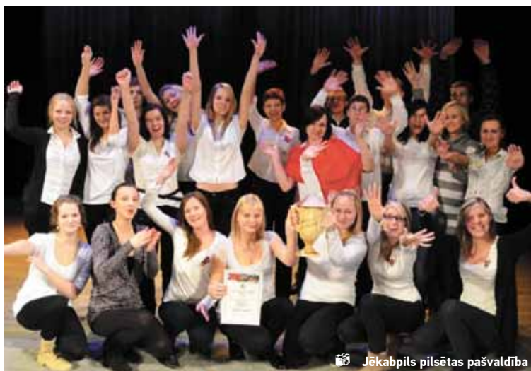
Jēkabpils pilsētas pašvaldība

29. martā Krustpils kultūras namā notika Jēkabpils Valsts ģimnāzijas parlamenta rīkots konkurss „Nocel jumtu”. Konkurssā piedalījās gandrīz visi ģimnāzijas skolēni, izņemot divpadsmitās klases. Dalībnieki uzstājās divās kārtās, katrā no tām tika dota iespēja nobalsot par skatītāju simpātiju. Katrai klasei bija jāiekļauj priekšnesumā kāda pārbaudīta vērtība, šis konkurss veicināja klases kolektīva sadarbību un saliedētību.