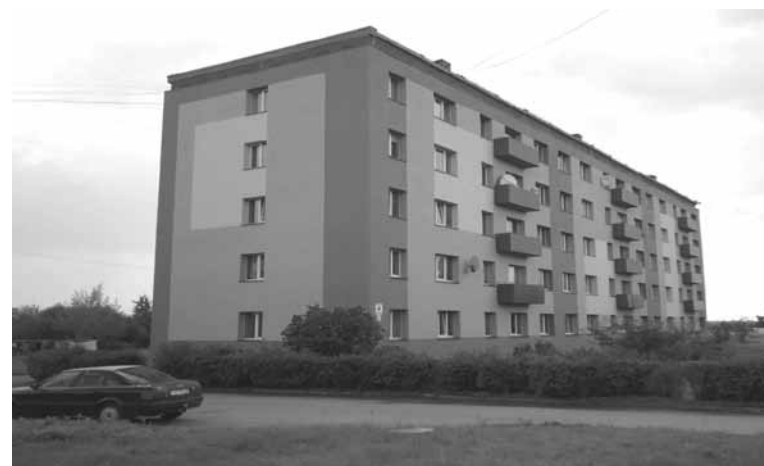
45 dzīvokļu daudzdzīvokļu māja Slimnīcas ielā 4, Jēkabpilī pēc renovācijas

Privatizējamās SIA „JK Namu pārvalde” darbinieki siltināšanas programmas ābeci apguva paši un ar lielu atbildības sajūtu dalījās pieredzē ar jēkabpiliešiem. Man atmiņā viena no sapulcēm, kurā MESA LATVIJA pārstāvis ar mājas iedzīvotājiem uzskatāmi un pārliecinoši diskutēja par dažādām iespējām, kā pareizi regulēt siltumu dzīvokļos, tādējādi sasniedzot papildus siltumenerģijas ekonomiju. Iedzīvotāji