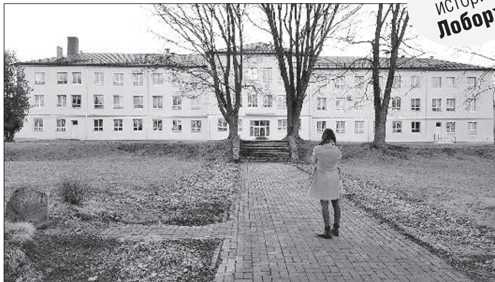
Вид на бывшую школу со стороны озера.

Есть большая вероятность, что Адамова — это топоним политического происхождения, образованный от имени собственного Адам. Возможно, этот встречаемый во многих местах Латгалии топоним каким-то образом связан с польским поэтом Адамом Мицкевичем (1798–1855), поскольку этот литературный деятель уже в 30-е годы 19-го века