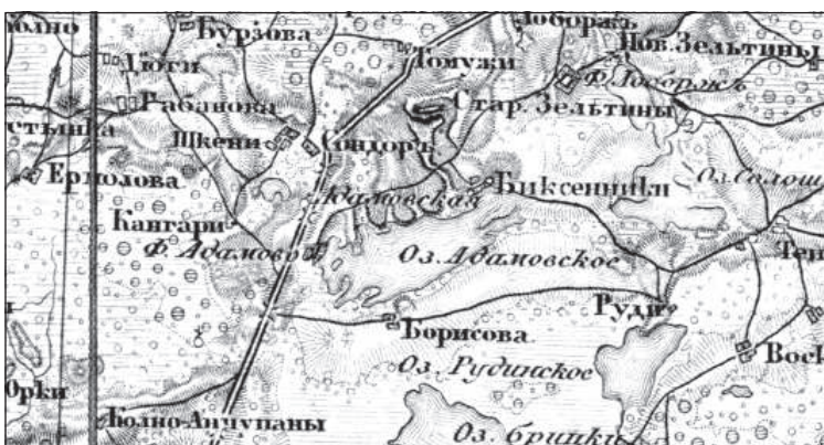
Адамова, карта середины 19-го века.

стал символом национального освобождения поляков. Его именем часто называли новорожденных детей, использовали при создании разных топонимов (названий поместий, полупоместий и др.) — таким образом проживавшие в Российской Империи поляки легально, но понятно для окружающих демонстративно мечтали восстановить Польское государство. Адам Мицкевич учился в Вильнюсе, работал в Каунасе, ездил в Санкт-Петербург мимо и через Инфлянтю, поэтому в географическом и культурном пространстве Латгалии его имя не является чужеродным или абстрактным. 4