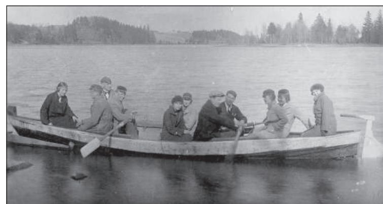
В большой лодке по Адамовскому озеру (30-е годы 20-го века).

В начале 20-го века Адамова «была курортом с водами всемирно известного источника Св. Елены. Источник найден в 1905 году и назван именем жены владельца поместья генерала Караулова. После проведенных на месте анализов профессором Войславом из Берлина в водах источника обнаружен богатый состав минеральных веществ, из-за чего он причислен к группе щелочно-солевых минеральных