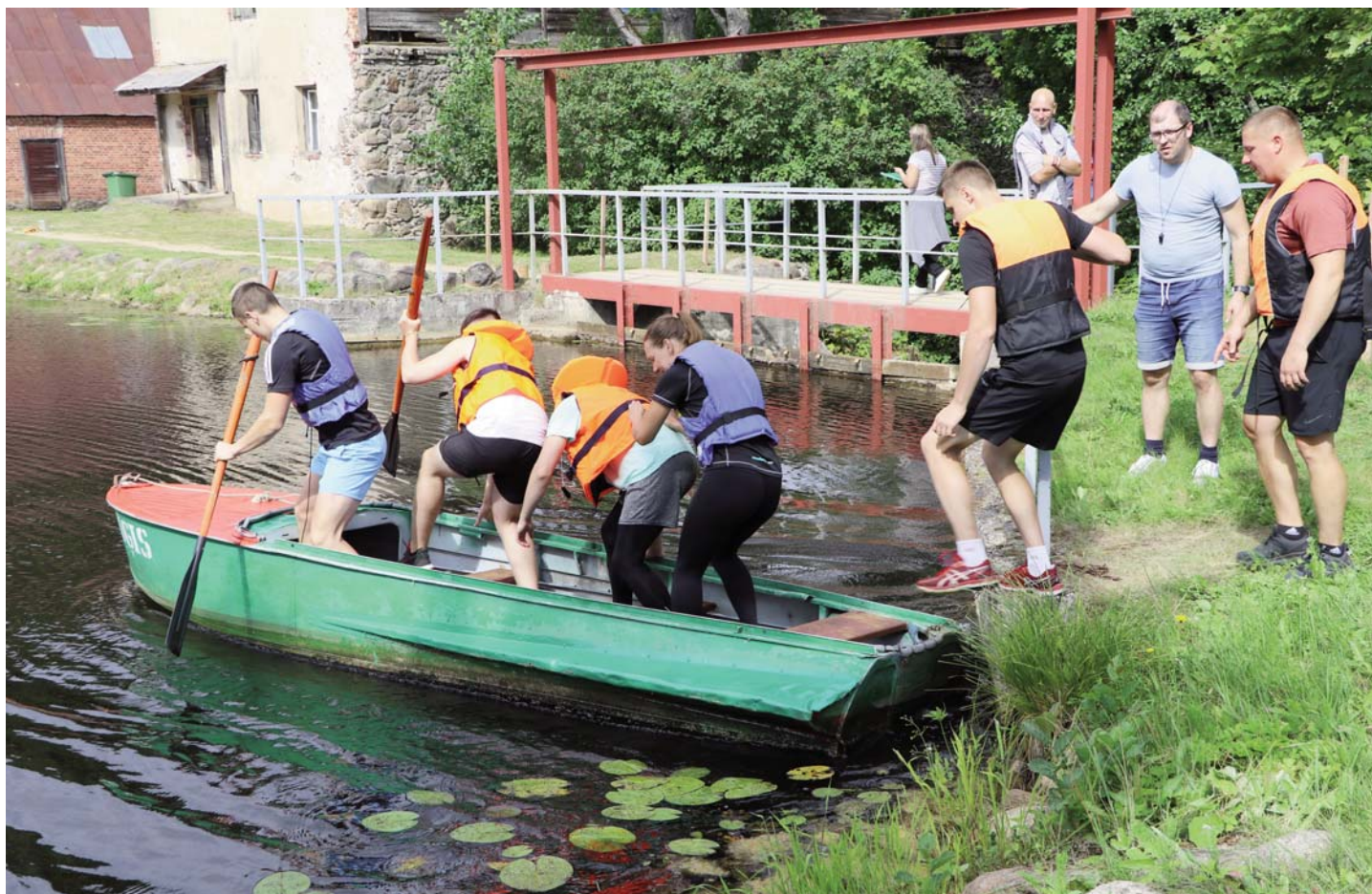
Aizvadīti tradicionālie sporta svētki Gārsenē.