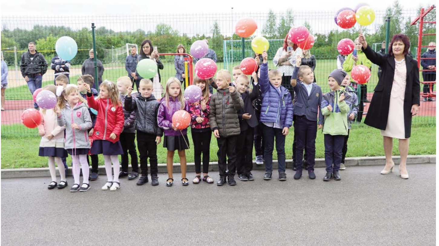
2020.gada 1.septembrī mācības Aknīstes vidusskolā uzsāka 19 skolēni