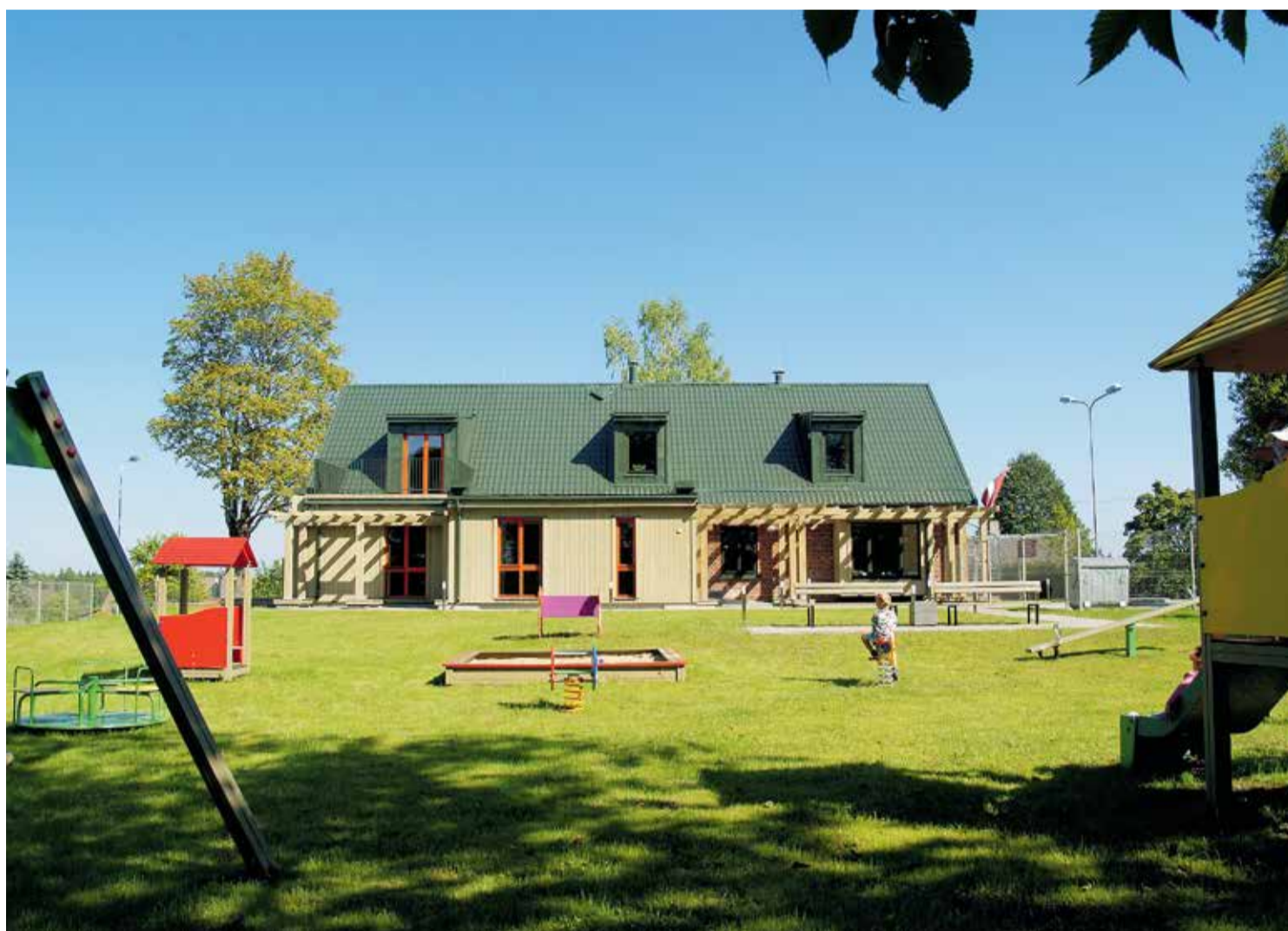
2015. gadā Katvaru pagasta Pociemā izveidota pirmsskolas izglītības iestādes filiāle.

Arī tad, kad veidojās pašreizējais Limbažu novads, tajā apvienojušies pagasti bija ļoti dažādi. Bet tā jau bija tā politiskā sratratne un redzējums, kā veidot novadu tā, lai būtu attīstība. Pēc iepriekšējās reformas, kad 2009. gadā sanāca jaunā Limbažu nova-