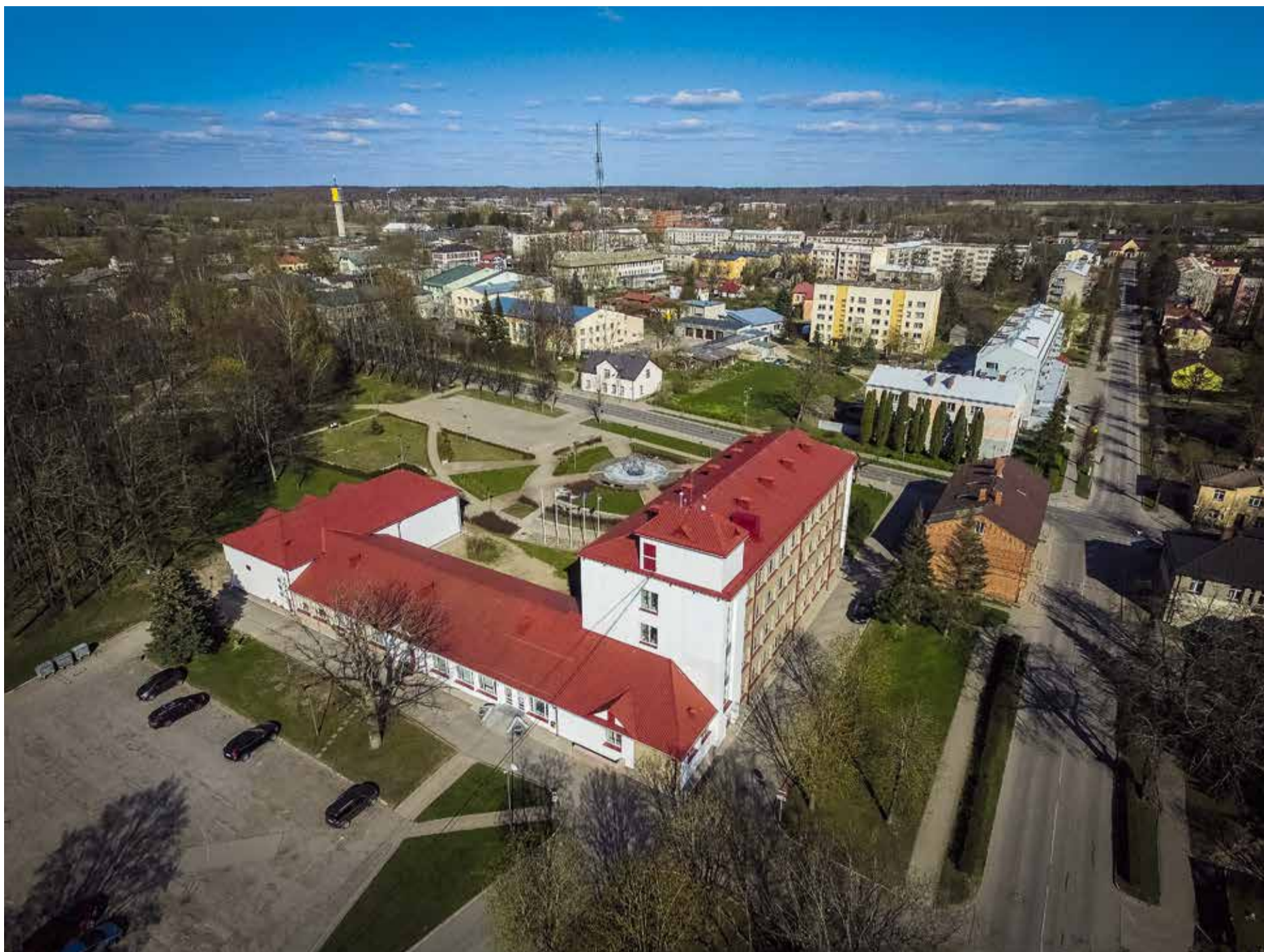
Pašvaldības ēkas foto.

smalkā politiskā izšķiršanās, kā veidojams novads, lai attīstības indekss nekristos, bet turpinātu augt. Mums jāspēj uz pašlaik notiekošajiem procesiem raudzīties kopīgi – kā lielai, vienotai pašvaldībai. Patīk tas mums vai nē, bet apvienotā pašvaldība būs, un tajā būs jādzīvo un jāstrādā visiem mūsu cilvēkiem.