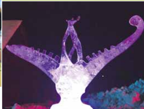
Arī šogad „Sēļu sētā” daļiņa no zemeslodes ledus atceļoja uz Jēkabpili un priecēja apmeklētājus ar savu neatkārtojamību.