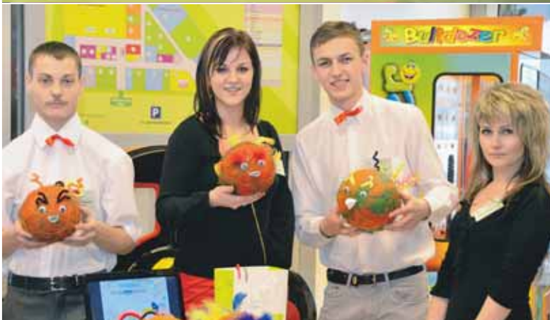
8. februārī Jēkabpilī notika skolēnu mācību uzņēmumu gadatirgus. Gadatirgus laikā skolēni iepazīstināja ar savu biznesa ideju, produkta ražošanas procesu un gūto pieredzi.