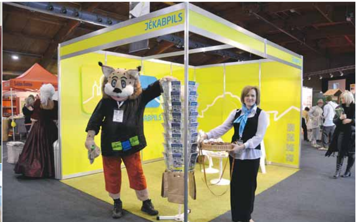
Uz izstādes „Balttour 2013” Jēkabpils stendu Rīgā bija atceļojis pats lūsis, lai aicinātu viesus apciemot Jēkabpili.