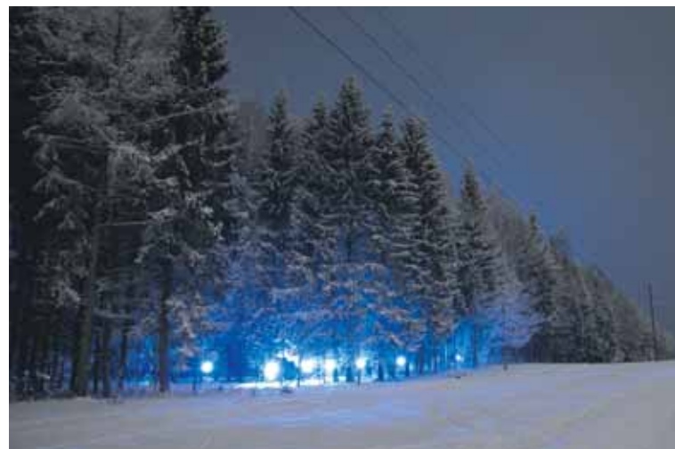
Par labāko janvāra fotomirkli balsojumā tika atzīta M.Beciša fotogrāfija, kurā iemūžināts Mežaparks

Viennozīmīgi skaistu zibens uzplaiksnījumu. Jau vairākus gadus