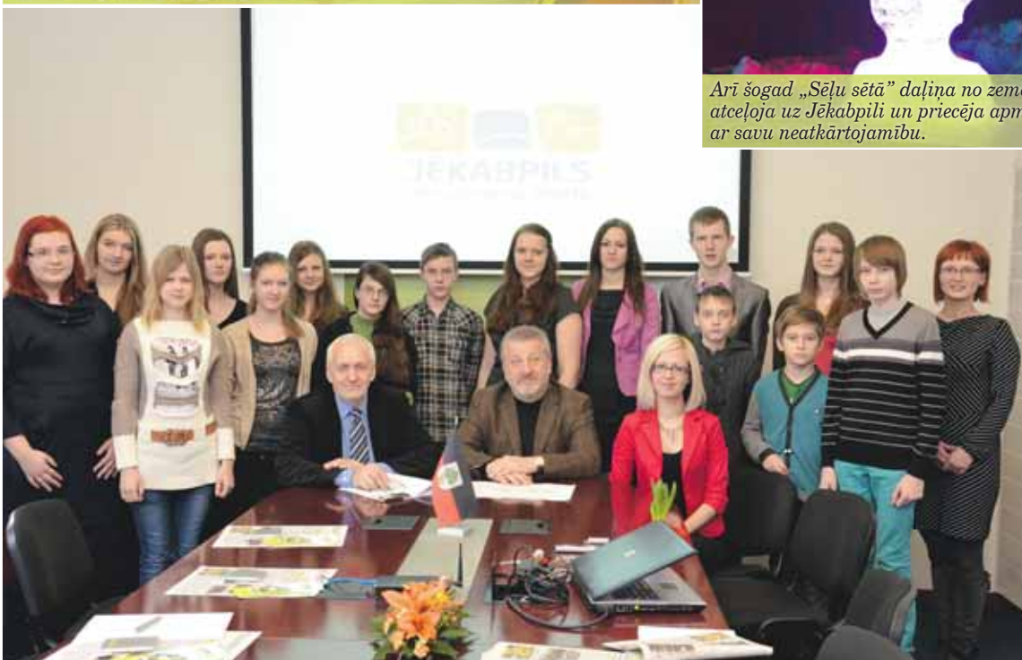
Šogad Jēkabpils pilsētas pašvaldībā „ēnoja” 15 skolēni. Visvairāk skolēnu izvēlējās iepazīt arhitekta profesiju.