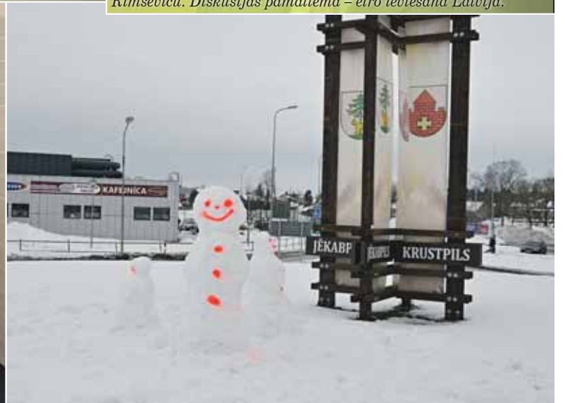
14. februārī uz Jēkabpili atceļoja sniegavīra ģimene.