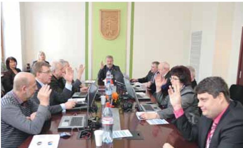
Februāra sākumā Jēkabpils pilsētas domes deputāti vienbalsīgi apstiprināja 2013. gada budžetu.