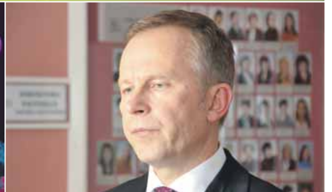
19. februārī Jēkabpils Valsts ģimnāzijā Jēkabpils Jauniešu dome rīkoja lekciju-diskusiju ar Latvijas Bankas prezidentu Ilmāru Rimšēviču. Diskusijas pamattēma – eiro ieviešana Latvijā.