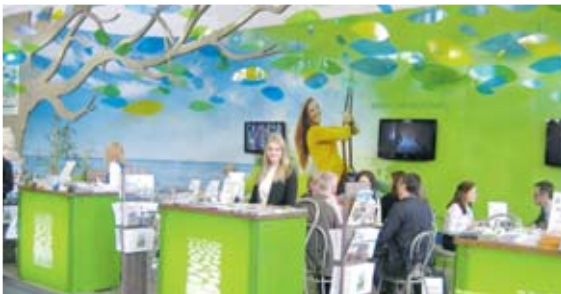
Jēkabpils tūrisma centrs 6.–10.martā piedalījās pasaulē vadošajā tūrisma izstādē „ITB” Berlīnē, Vācijā