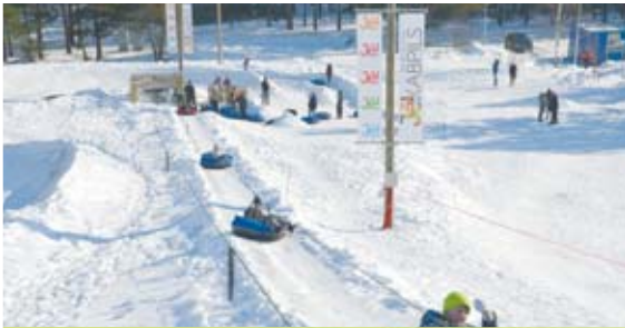
Martā Jēkabpils pilsētas pašvaldība 5.–7.klašu skolēniem un brīvprātīgajiem jauniešiem sniedza iespēju bez maksas izmantot Jēkabpils slēpošanas kalnu