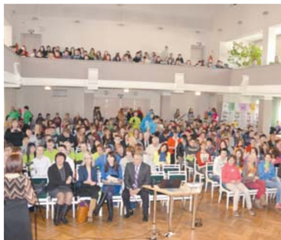
Jēkabpilī pirmo reizi norisinājās Karjeras diena pamatskolēniem, kas pulcēja vairāk nekā 350 skolēnu