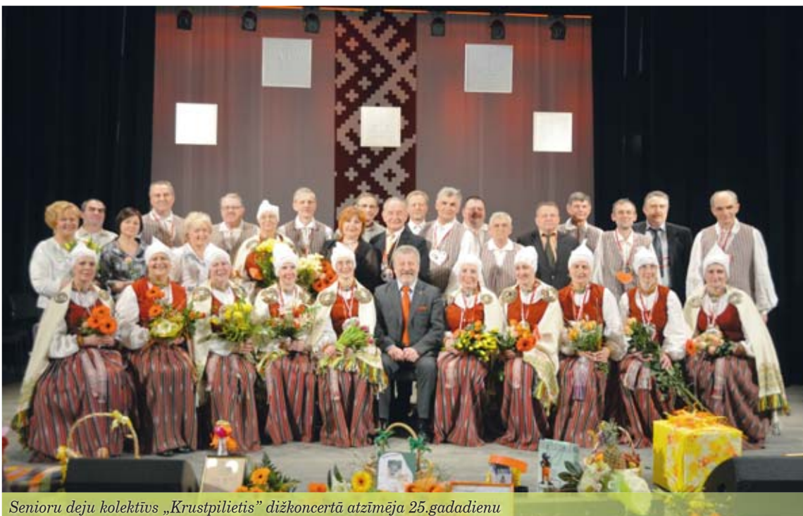
Senioru deju kolektīvs „Krustpīlētis” dižkoncertā atzīmēja 25.gadadienu