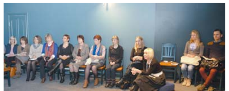
5.martā Jēkabpils tautas nama kamerzālē notika Imanta Ziedoņa piemiņas vakars „Ziedoņa gara gaismā”