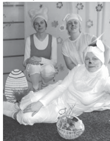
„Muzikālie zaķi”