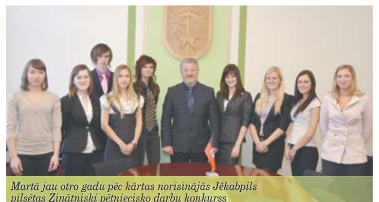
Martā jau otro gadu pēc kārtas norisinājās Jēkabpils pilsētas Zinātniski pētniecisko darbu konkurss