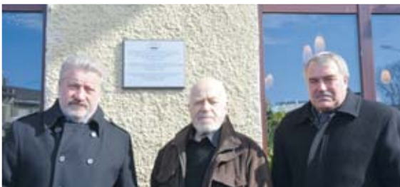
26.martā Jēkabpilī atklāja piemiņas zīmi Emīlam Knaģim