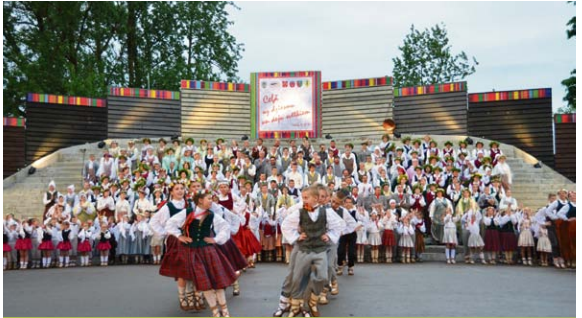
Jēkabpils pilsētas un apkārtnē novadu kolektīvi dziedāja un sadancoja dižkoncertā „Ceļā uz dziesmu un deju svētkiem”