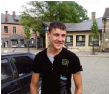
Didzis – It kā nekas, nē, tomēr – karstums.