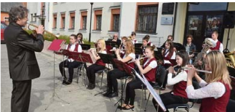
Latvijas Republikas Neatkarības dienas svinības Jēkabpilī arī šogad ieskandināja Jēkabpils Valsts ģimnāzijas pūtēju orķestris „Vitamins” diriģenta Harija Zdanovska vadībā