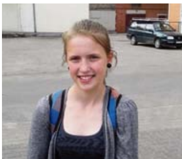
Gīta – Mākoņi