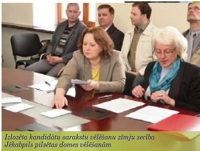
Izlozēta kandidātu sarakstu vēlēšanu zīmju secība Jēkabpils pilsētas domes vēlēšanām