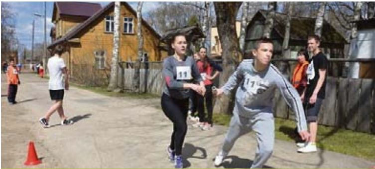
1.maijā Kena parkā jau trešo gadu norisinājās stafēšu skrējieni, kurā piedalījās 19 komandas