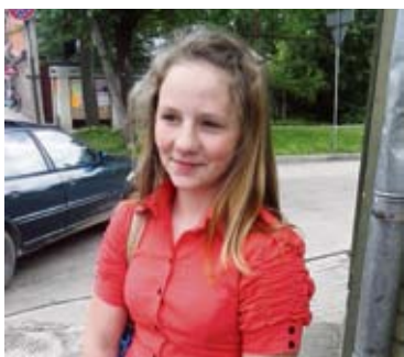
Simona – Satraukums. Par visu.