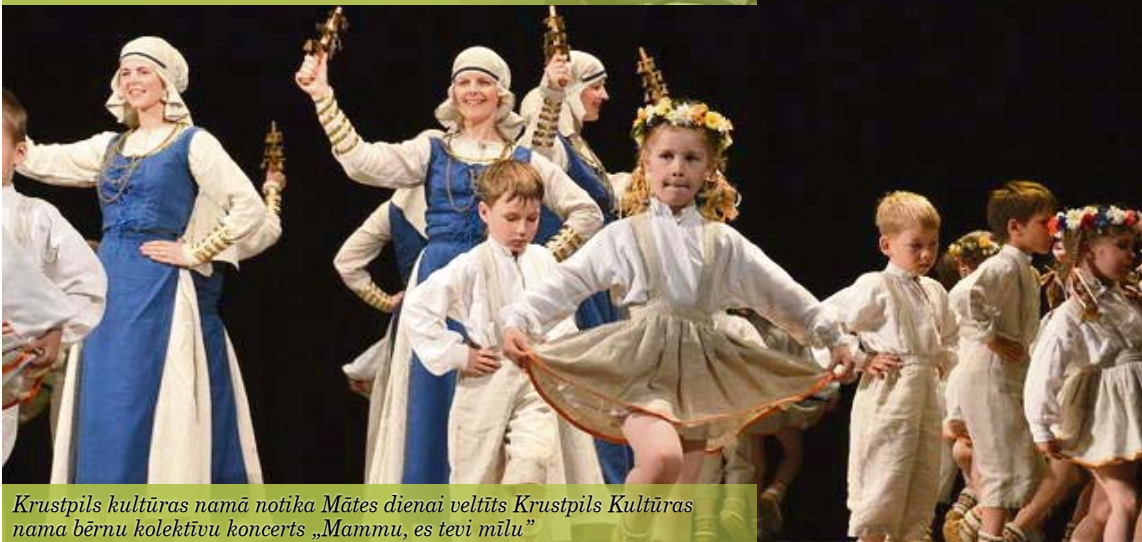
Krustpils kultūras namā notika Mātes dienai veltīts Krustpils Kultūras nama bērnu kolektīvu koncerts „Mammu, es tevi mīlu”