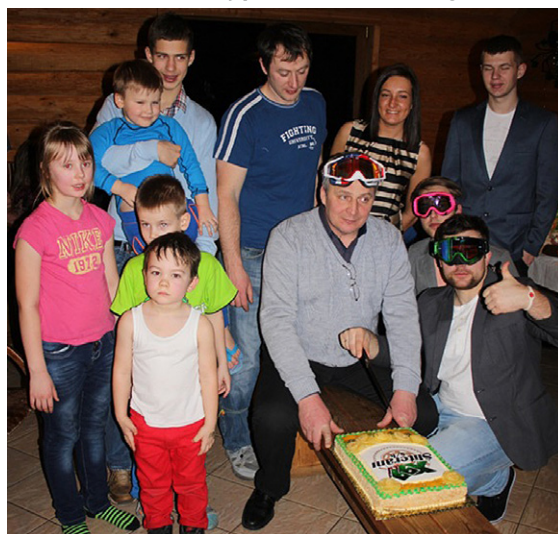
Jaunie komandas biedri.