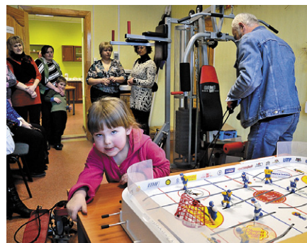
Bērniem ļoti patika jaunais sporta inventārs.

Dignājas sabiedriskais centrs ir atvērts ikvienam interesentam, centra telpās jau aktīvi darbojas aktīvā dzīvesveida klubīšs „Sprīdis labākai dzīvei”, kā arī aizvien lielāku interesi izrāda tie iedzīvotāji, kuri vēlas sportot un pavadīt savu laiku centrā individuāli. Centra telpās ir iespējams izmantot lielo trenāžieri, stepperus, vingrošanas inventāru (lielās un mazās bumbas, vingrošanas gumijas, vingrošanas paklājiņus, espanderus u.c.), tenisa galdu, galda hokeju, multimediju komplektu, kā arī vienkārši iedzert siltu tēju un labi pavadīt laiku sarunās. Ir pieejams Wi-Fi.