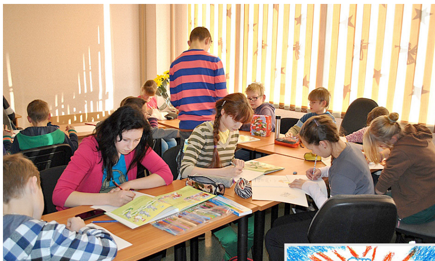
Bērni iemēģina savu roku Stārastes tēlu zīmēšanā.