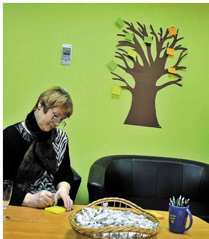
Ikviena varēja atstāt savu vēlējumu labo domu kokā.

Šā gada 23. janvārī Dignājas pamatskolas ēkas I stāvā tika organizēta „Labo domu pēcpusdienu” un, tās ietvaros, atklātas sabiedriskā centra telpas. Atklāšanas dienā apmeklētāji iepazīnās ar sabiedriskajā centrā pieejamo inventāru, kas iegādāts ar projekta starpniecību, un arī ar skolas un pagasta inventāru, ko iespējams izmantot, lai pilnvērtīgi varētu pavadīt laiku sabiedriskajā centrā. Tajā pat dienā tika izrādīta liela interese par centrā pieejamo sporta inventāru, izmēģināti trenāžieri un spēlēts galda hokejs un galda teniss. „Labo domu pēcpusdienā” tika izveidots labo domu koks, kura zarus rotā centra apmeklētāju laba novēlējumi: lai vienmēr ir kas jauns, neparasts un oriģināls, kas pašiem rada prieku un spēj pārsteigt un iedvesmot arī visu novadu, lai izdodas vienot Dignājas iedzīvotājus radošām aktivitātēm, vēlu šim centriņam, kreatīvas