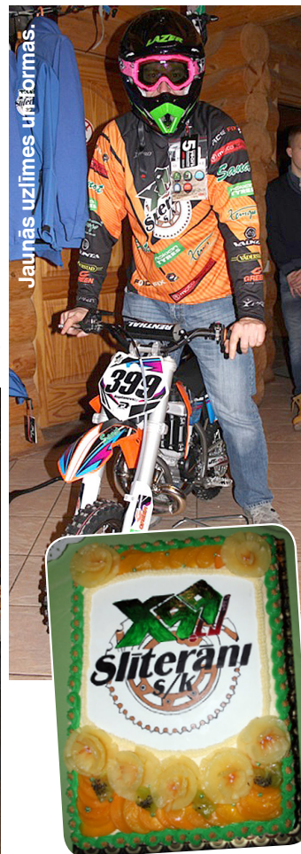
Torte ar jauno komandas logo.