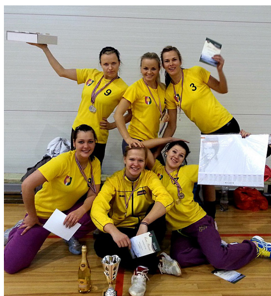
Jēkabpils novada meiteņu komanda.