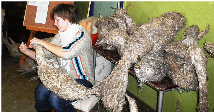
Kaldabruņas skolā tiek darināti putni no kaņepju šķiedras.

Ar līdzfinansējumu 7% apmērā projektu atbalsta Jēkabpils novada pašvaldība.