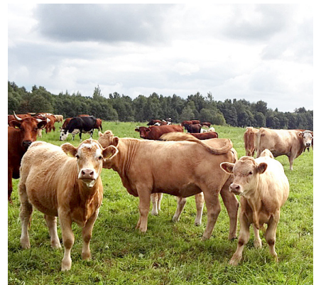
z/s „Melderī”, Rubenes pag.