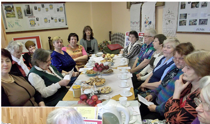
Akuratera atcere Ābeļu novadpētniecības telpās.