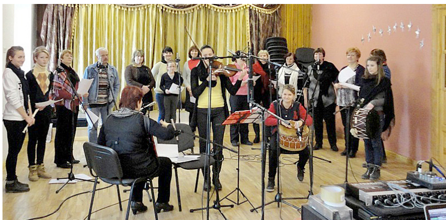
Folkloras kopa „Dignojiši” pārtraukumā starp ierakstiem.

26. janvāris folkloras kopas „Dignojiši” dalībniekiem sākās ar neparastu satraukuma un reizē svētku sajūtām. Nebijis notikums kopas pastāvēšanas laikā – CD ieraksts.