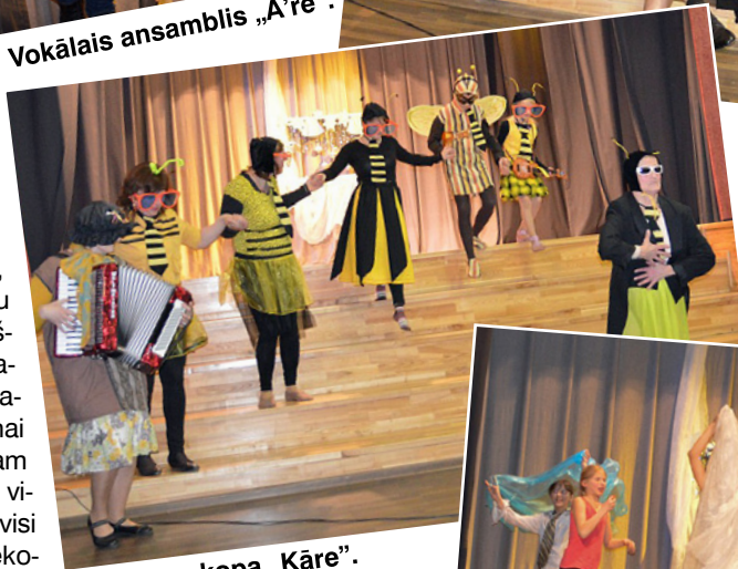
Folkloras kopa „Kāre”.