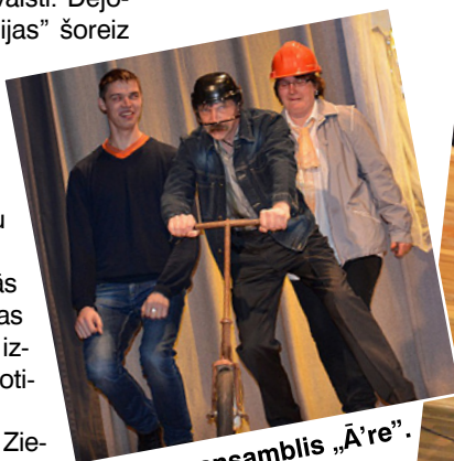
Vokālais ansamblis „Ā're”.