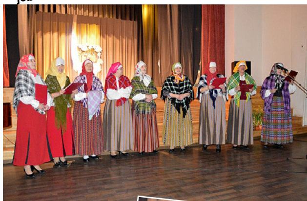
Vokālais ansamblis „Kantilēna”.