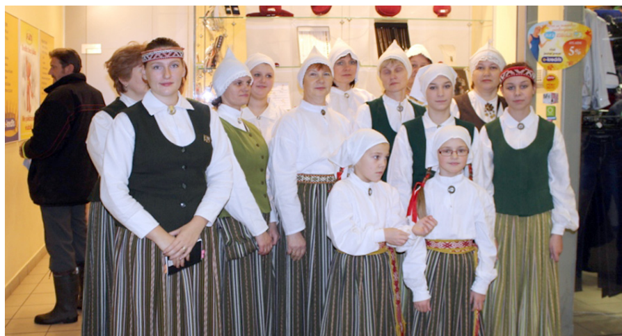
Folkloras kopa „Dignōjieši” pedalās akcijā „Pasniedz roku”.