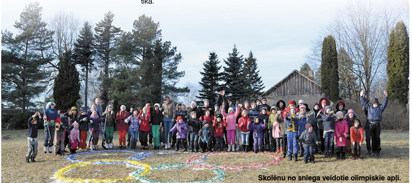
Skolēnu no sniega veidotie olimpiskie apļi.