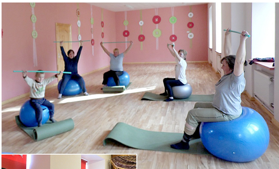
Vingro gan lieli, gan mazi.

Kad visi, visi savācamies, tad esam kādi 15. Bet nekad jau tā neiznāk. Ir bijis pat tā, ka kādi 3, 4 atnākam.. Bet tad gan liekas, ka mūsu intereses ir līdzīgas, un mēs vingrojam to, ko mēs tiešām tajā brīdī gribam, jo, kad esam vairākas, tad jau tās intereses ir ļoti dažādas. Viena varbūt grib tikai līnijdejas, viena grib tikai nūjot, Viena grib ārstniecisko vingrošanu un cita atkal grib kalorijas nodedzināt un muskuļus tā kārtīgi uztrenēt. Dalās mums tās vēlmes, jā, bet mēs tomēr turamies kopā.