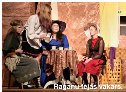
Raganu tējas vakars.