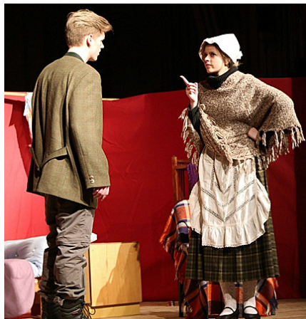
Pamāte pārmāca labsirdīgo vīru.