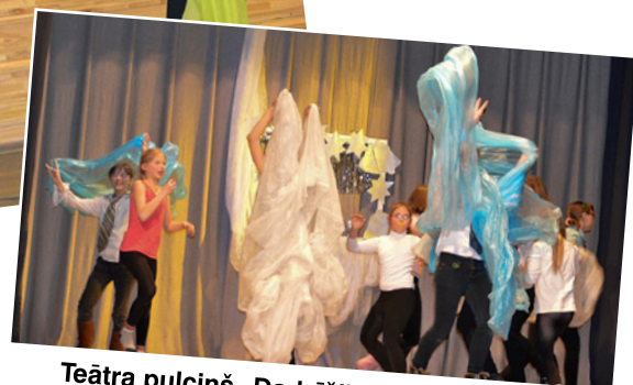
Teātra pulciņš „Dadzīši”.