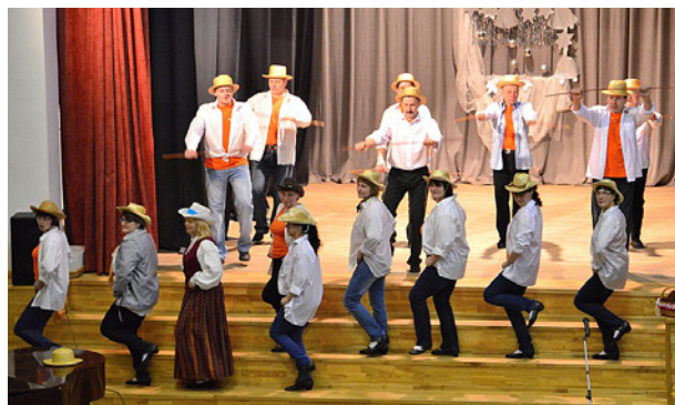
Deju kolektīvs „Rasa”.