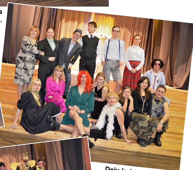
Deju kolektīvs „Laude”.