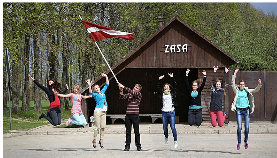
Jauniešu apvienības „Miljons iespējas” lēciens pretī brīvībai un jaunām iespējām!