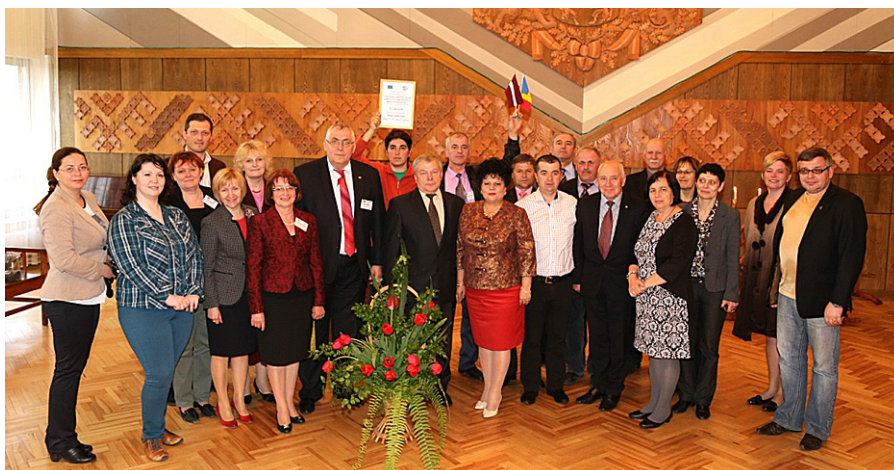
Kopilde pēc sertifikātu ceremonijas Viesītē.

lēguma konference, savukārt, vietējās aktivitātes – semināri skolotājiem, vasaras akadēmija skolēniem un viņu vecākiem, izpētes pasākumi, izstāde, brošūras izveide un druka, svešvalodas apmācības personālam, informācijas tehnoloģiju pielietojšanas prasmju uzlabošana ir plānotas, lai sasniegtu projekta mērķi.