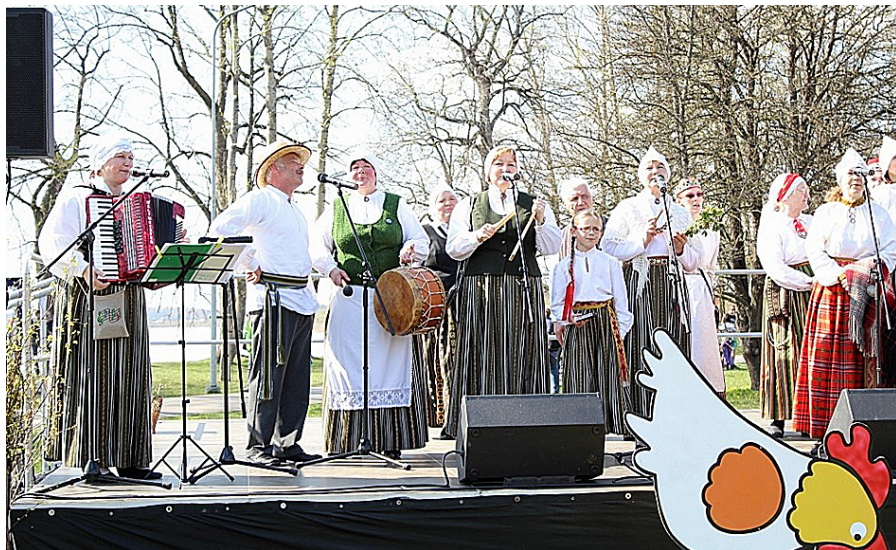
Kopā ar folkloras kopu „Rati”.

Bija ieradies Lieldienu zaķis, kas papildināja svētkus ar zaķu skrējieni, zaķu vingrošanas nodarbībām, vizināšanos ar ponijiem, lēkāšanu pa piepūšamajām atrakciju pilsētiņām. Arī zaķu saimniece organizēja dažādas aktivitātes – Lieldienu