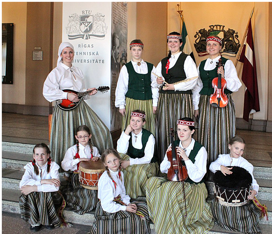
Muzikanti un dziedātāji Rīgas Tehniskajā Universitātē pēc konkursa.