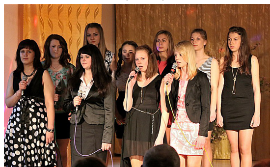
Klausītāju sirdis aizkustina dziesmas par skolu.