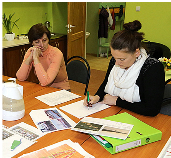
Komisija izskata dizaina piedāvājumus.

Šobrīd „Dignōjšu” pirmais iedziedātais kompaktdisks tiek reproducēts un izgatavots vāciņš ar Dignājas iedzīvotāju izstrādāto dizainu, savukārt, kopa uzsāks gatavoties kompaktdiska prezentācijas