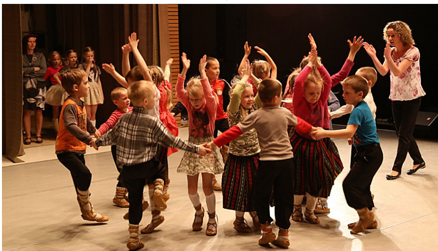
Zasas vidusskolas dejojāji mēģinājumā pirms skates.