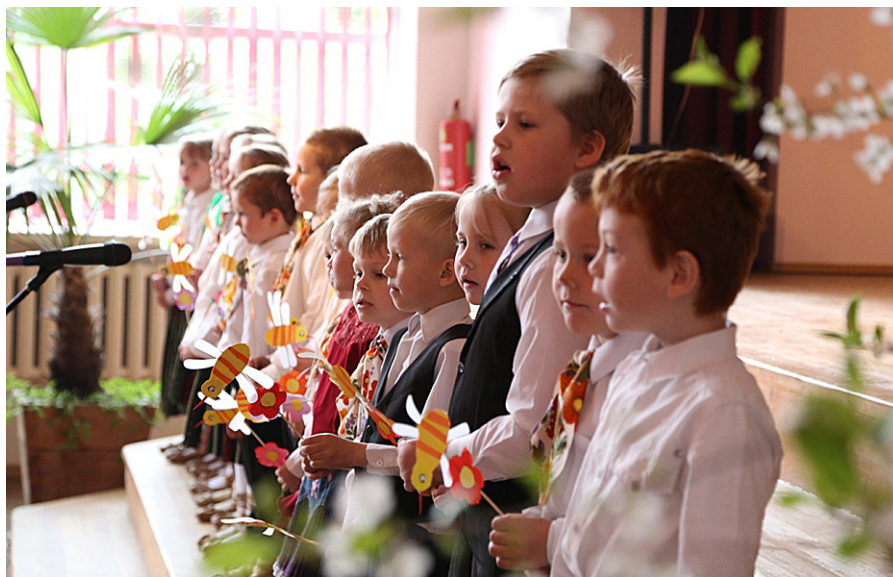
„Vasaras akadēmija” nometnes bērni sniedz koncertu.