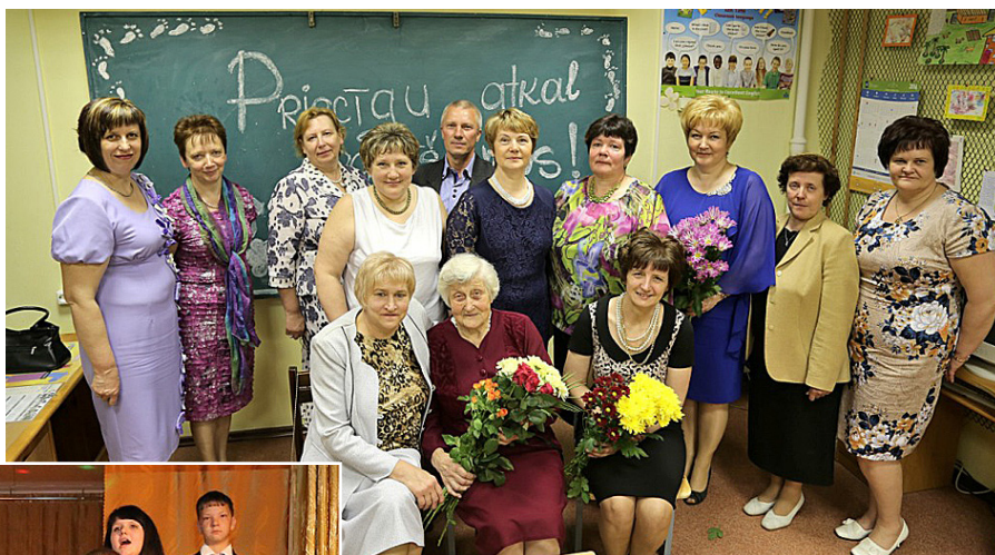
Absolventiem prieks par atkalredzēšanos.