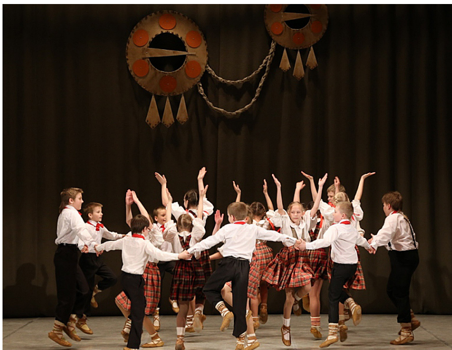
Dejo Ābeļu pamatskolas 1. – 4. kl. deju kolektīvs.