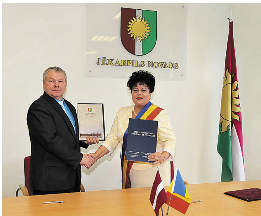
Sadarbības līguma parakstīšana starp Jēkabpils novada un Cumpāna pašvaldībām.

vadītāji kopīgi iestādīja arī koku Rubenes dabas parkā, kas kalpos kā izglītības un sadarbības simbols.