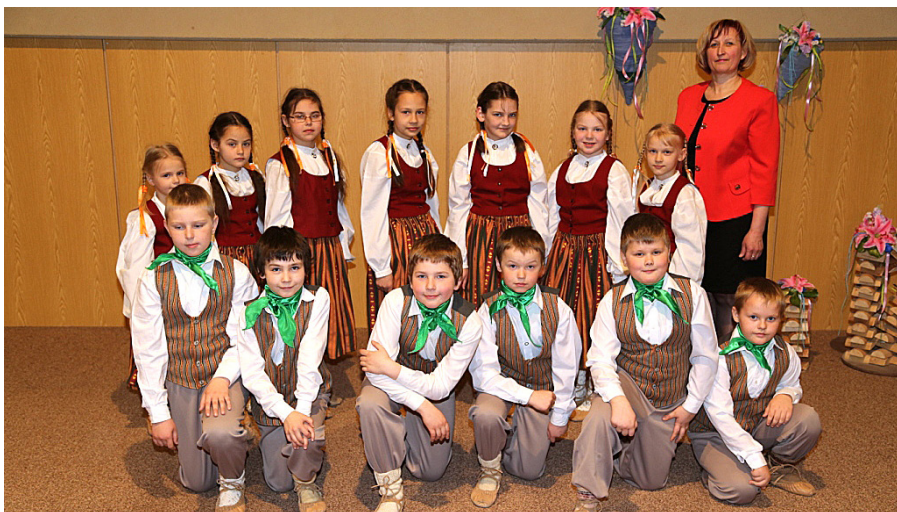
Rubeņu pamatskolas 1. – 4. kl. deju kolektīvs.