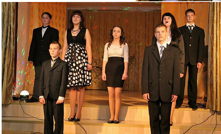
Skat dzejas vārsmas skolēnu izpildījumā.