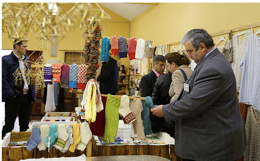
Rumāņi iepazīst vietējo rokdarbnieču darbus Viesītes amatniecības centrā.