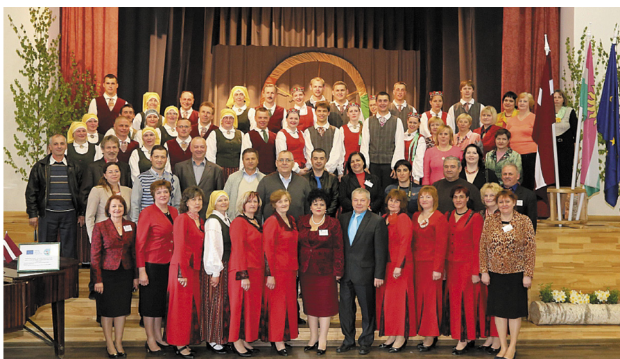
Rubeņu kultūras namā pēc pašdarbnieku koncerta.