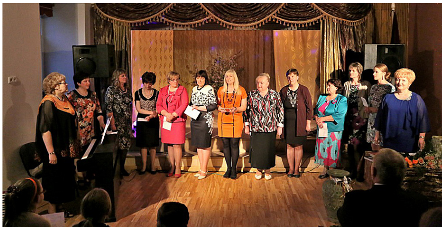
Skolas darbinieki sveic absolventus.