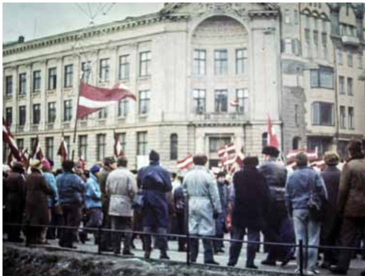
Barikāžu dalībnieki sastājušies cieši.