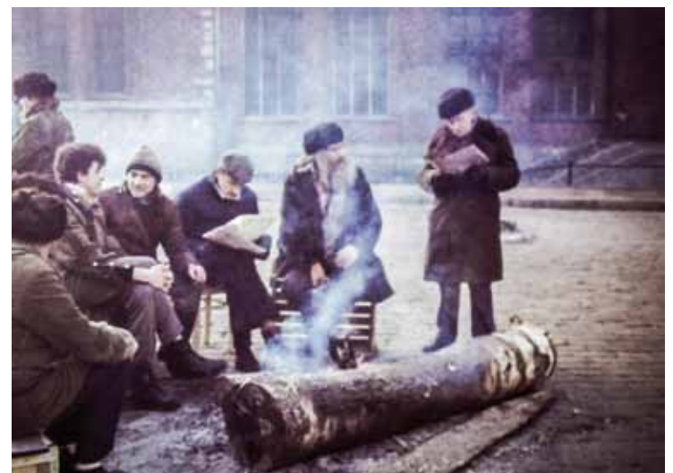
Rendenieki sargā barikādes pie Doma baznīcas.