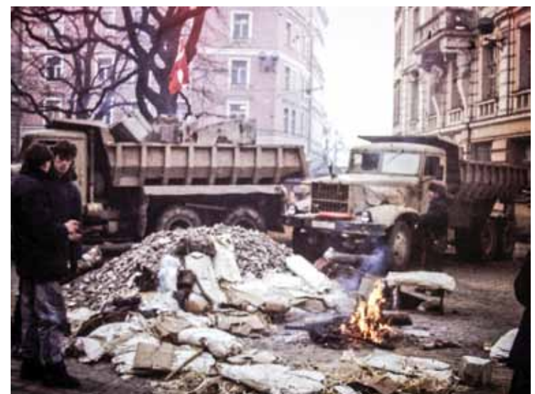
Smagā tehnika un malkas kravas neļāva padomju armijai piekļūt Vecrīgai.

dētākajiem. Tobrīd aktuāli bija nosargāt brīvību, Rīgu un pašiem palikt dzīviem.