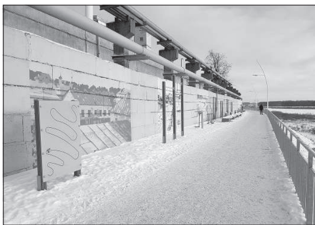
Перестроенная улица Бругю.