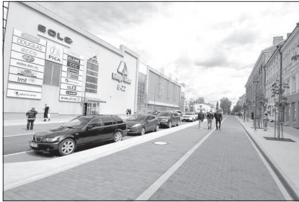
Обновленный участок улицы Ригас.

Комплекс застройки Даугавпилсской средней школы дизайна и искусств «Saules skola» будет заявлен сразу в 3-х номинациях: здание на ул. Саулес, 6, будет бороться за звание лучшего нового строения, здание на ул. Саулес, 2, –