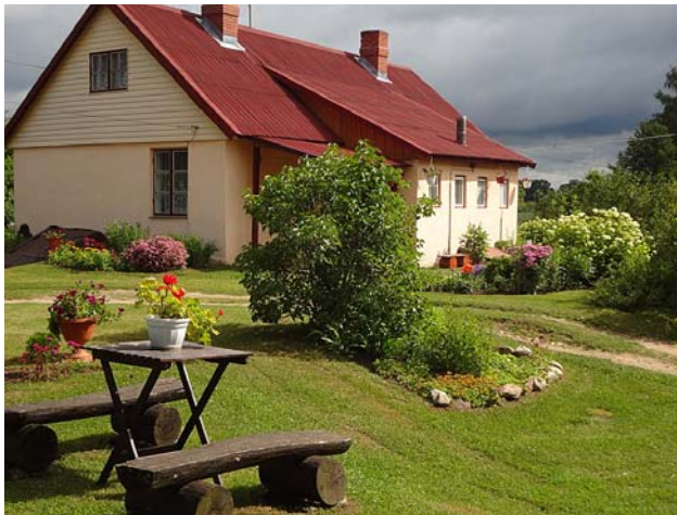
Leimaņu pag. „Brīviņi” – Valija Gatiņa un Ainis Krievāns.

5. Nominācija – uzņēmējdarbības labākie piemēri: