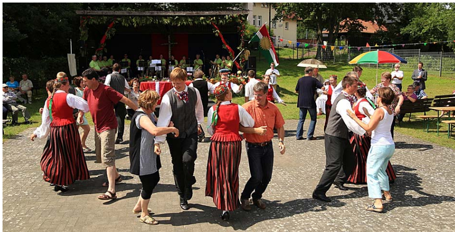
JDK „Laude” vāciešiem māca plaukstiņpolku

Nopietni pārdomātā un piedāvātā objektu apskate ļāva daudziem gūt nelielu priekšstatu par Mēklenburgas zemes zaļo dabu, cilvēku sirsnību un atsaucību,