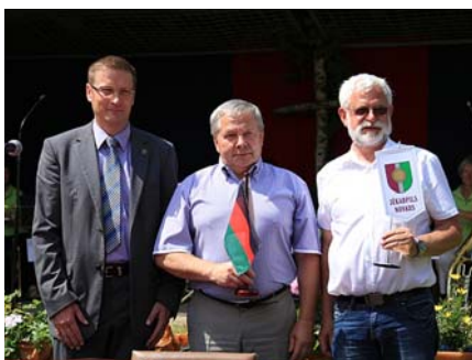
Pēc līguma noslēgšanas starp Jēkabpils novada un Parhimas pašvaldībām.

pāri galvai lidojošu lidmašīnu vērošanai, mums bija iespēja pašiem pabūt „debesīs” – skatotornī vienā no augstākajām Parhimas pašvaldības virsotnēm. Ainavu visapkārt rotāja vēja ģeneratoru un saules bateriju parki. Tāpat arī apmeklējām modernās mākslas muzeju un parku, kurā visas it kā ikdienā nevajadzīgās lietas, piemēram metāllūžņi, bija pārvērstas neparastos un interaktīvos objektos. Visas dienas garumā tikām arī bagātīgi ēdināti