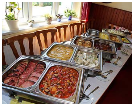
Ēdiens bija ļoti daudzveidīgs.

moderno mākslu, kulinārijas un ēdienu gatavošanas receptēm, par ciemiņu uzņemšanu, par baznīcas iesaisti svētku norisē, par ugunsdzēsēja-glābēja profesijas augsto prestižu valsts un pašvaldības līmenī, par augsto apziņu un brīvprātīgu iesaistīšanu šajā darbā.