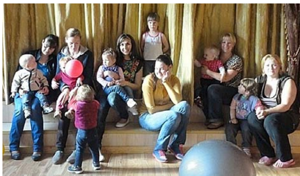
Pirmā kopbilde jauno ģimeņu klubiņā.