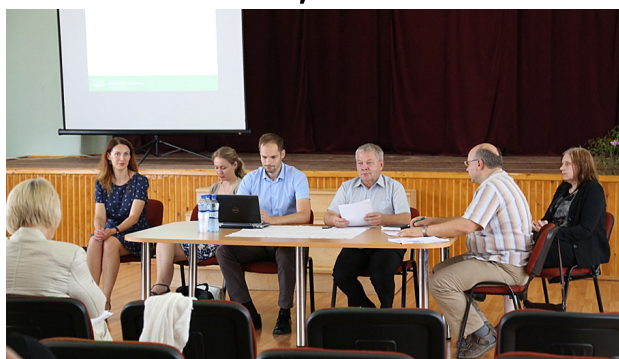
Ministriju pārstāvji Leimaņos.

Semināra dalībnieki iepazina Jēkabpils novadu, kā arī atbildēja uz jautājumiem un stāstīja par jaunā plānošanas perioda aktivitātēm. Tika izskatītas tādas tēmas, kā: problēmas ar dzīvo-