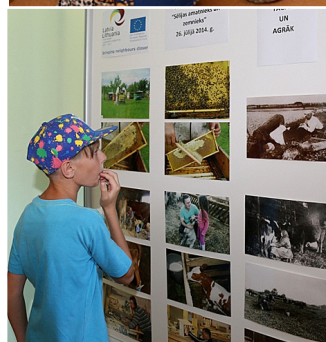
Bērni iepazīst izstādi „Sēlijas amatnieks un zemnieks toreiz un tagad”.

aicinājumam. Dalībnieku vidū azarts un cīņas spars bija milzīgs. Komandas tika apbalvotas ar veselīgām un garšīgām balvām. Dalībnieki apmierināti, starojoši devās mājās ar ieteikumu rīkot arī turpmāk šādas pēcpusdienas. „Paldies visiem pasākuma dalībniekiem par piedalīšanos un nenogurstošo enerģiju, jo dalībnieku skaits sniedzās pāri simtam, sākot ar zidaiņu vecumu un beidzot ar dalībniekiem sirmām galvām, bija arī atbalstītāji”, stāsta Kalna pagasta kultūras nama