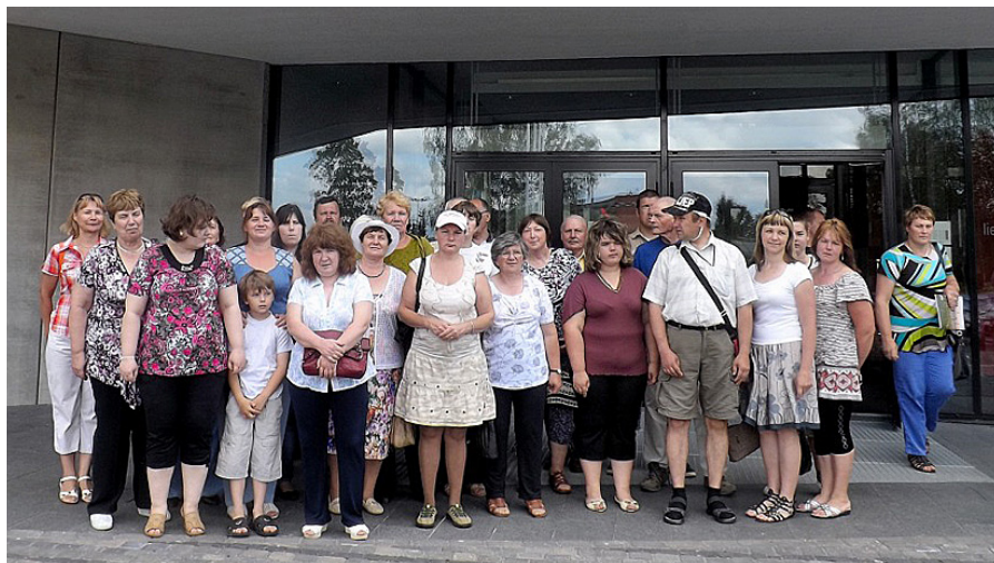
Pie Austrumlatvijas koncertzāles „Gors”.

veidīgāk, jūtami uzlabo kopējo dzīves vidi.