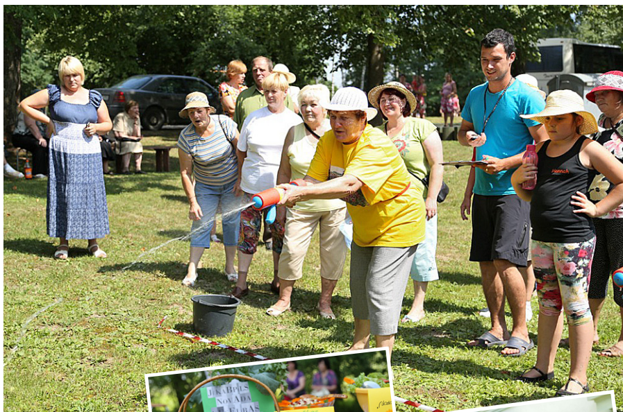
Senioru sporta spēlēs Kalna pagastā.

„Amatniecības popularizēšana ir projekta mērķis, lai cilvēkus iedrošinātu nodarboties ar šo seno amatu. Festivāla pasākumi noslēgušies, bet cerams, ka iedzīvotājiem projeta ietvaros iegūtā informācija un prasmes palīdzēs nodrošināt šī projekta mērķa sasniegšanu. Novada muzejā paš-