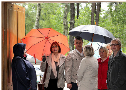
Vērtēšanas komisija pēta objektu.

Informāciju sagatavoja K. Sēlis