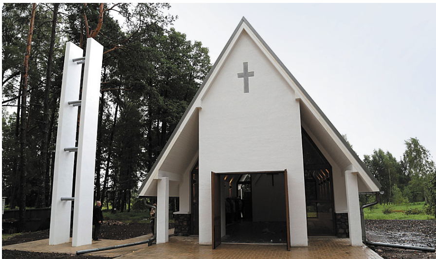
Jaunā Rubeņu kapsētas kapliča.