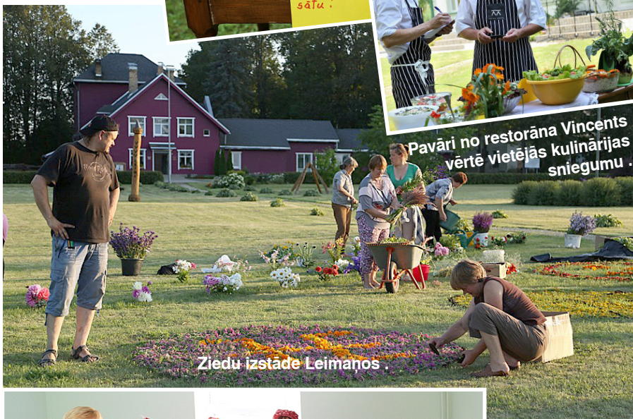
Ziedu izstāde Leimaņos.