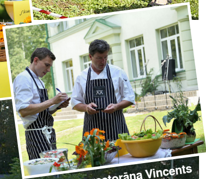
Pavāri no restorāna Vincents vērtē vietējās kulinārijas sniegumu.