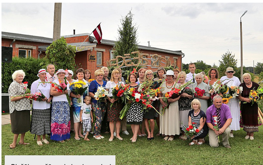
Plašāk par šā gada konkursu lasi laikraksta „Brīvā Daugava” 14. augusta izdevumā