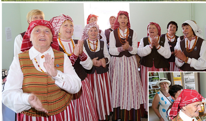
Folkloras kopa „Šatrija” sniedz muzikālu priekšnesumu.

māju amatnieku darinājumi un fotogrāfijas būs apskatāmas ilgu laiku. Aicinu visus interesentus tajā ienākt un iepazīties ar piedāvāto materiālu.”